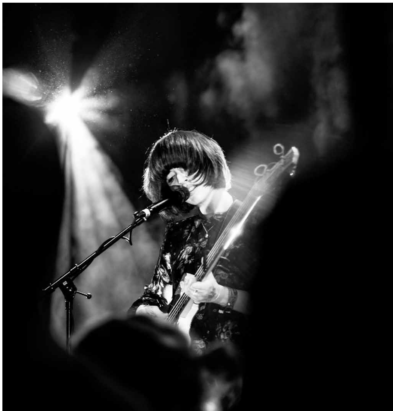
Un retour sur la photographie de concerts ayant eu lieu à l'Exit07 est organisé au Carré Rotondes « Three Songs No Flash » - jusqu'au 31 août.