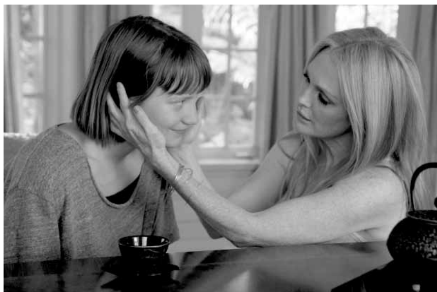
David Cronenbergs Abrechnung mit dem Wahnsinn in Hollywood kommt nun endlich auch in unsere Kinos: „Maps to the Stars“ - neu im Utopia.