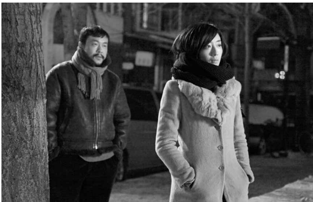
Femme fatale au premier plan et détective flou à l'arrière : un classique du film noir et une image récurrente de « Black Coal ».