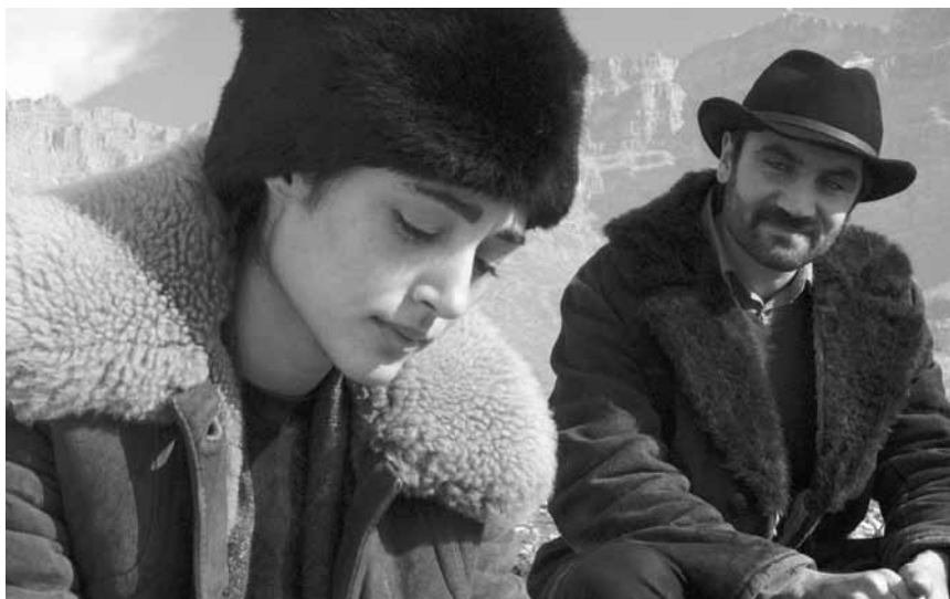
Ein Western im wilden Kurdistan: „My Sweet Pepper Land“ - neu im Utopia.