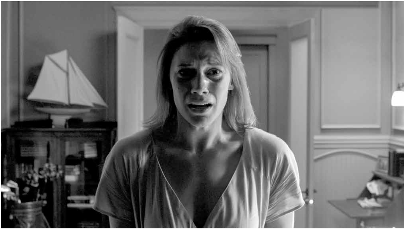
Hat das Böse sich in der Familie erst einmal breit gemacht, gibt es auch 11 Jahre später kein Entrinnen: „Oculus“, neu im Utopolis Kirchberg.

dessen Vater Bangun verschaffen. Nach zwei Jahren Haft schafft es der verdeckt ermittelnde Cop tatsächlich, eine wichtige Position in Banguns Verbrecherorganisation zu ergattern.