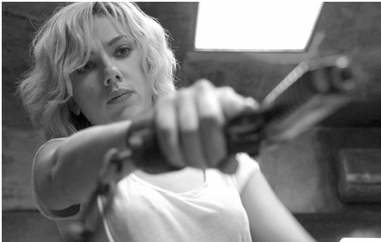
Ticken Drogenkuriere nicht so wie geplant, ist jede Menge Action angesagt: „Lucy“ der neue Film von Luc Besson mit Scarlett Johansson, neu im Ariston, Ciné Waasserhaus, Scala, Starlight, Sura, Utopolis Belval und Kirchberg.

Starlight, 3D: Fr. 19h, Sa. 16h + 21h30, So. 19h30, Mo. 16h + 19h, Di. 16h (dt. Fass.).