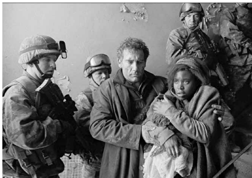
„Children of Men“ - Alfonso Cuaróns Dystopie einer Welt ohne Kinder läuft am Mittwoch in der Cinémathèque.

Dijon : Jeanne s'ennuie auprès d'Henri, son mari, dans le milieu de la haute bourgeoisie. Le hasard lui fait rencontrer Bernard, un jeune homme anticonformiste. Dans la douceur