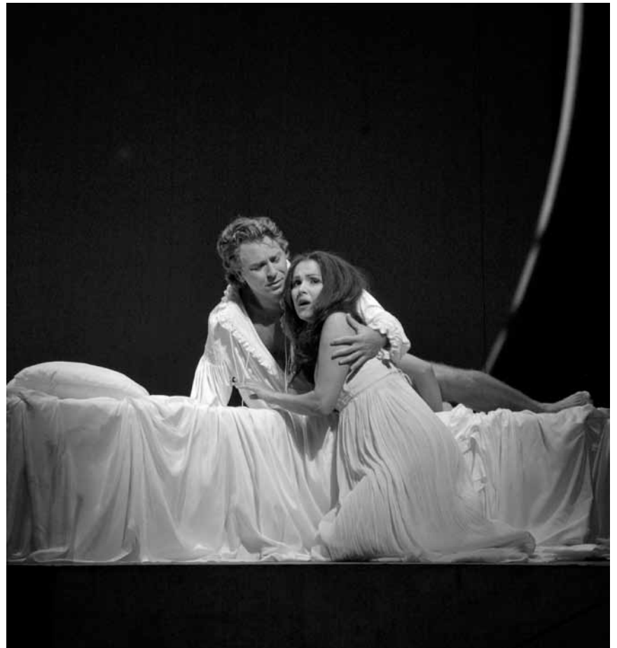
Anna Netrebko and Roberto Alagna are the two main attractions in Charles Gounod's famous adaptation of « Romeo & Juliet », next Tuesday at Utopolis as a part of the Met Summer Encores.