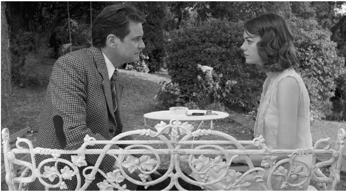
Ob Hellseherin oder Rotzgöre. - Sophie (Emma Stone) weiß Stanley (Colin Firth) zu verzaubern.