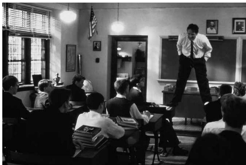
Sternstunde seiner Schauspielkarriere: Das Kinosch erinnert an diesem Freitag und Samstag mit „Dead Poets Society“ an Robin Williams.

Zehn Jahre sind vergangen, seit ein freigesetztes Virus den Großteil der Menschheit ausgerottet hat. Der übrig gebliebene Rest haust in Ruinen und lebt ein zurückgezogenes Leben im Untergrund. Eine Expedition in die Wälder, angeführt von Malcolm, trifft auf das von Caesar angeführte Affenvolk. Malcolm und Ellie erwirken ein Friedensabkommen mit Caesar, das jedoch von kurzer Dauer ist.