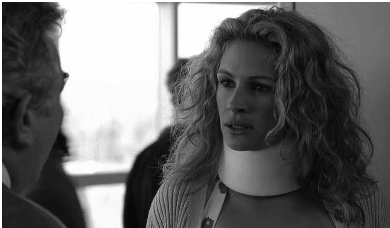
Dans « Erin Brockovich », Julia Roberts prouve le 28 août à 20h30 qu'elle n'est pas que « Pretty Woman ». A la Cinémathèque.

BRD 1974 von Rainer Werner Fassbinder. Mit Hanna Schygulla, Karl-Heinz Böhm und Wolfgang Schenck. 140'. O.-Ton, fr. Ut.