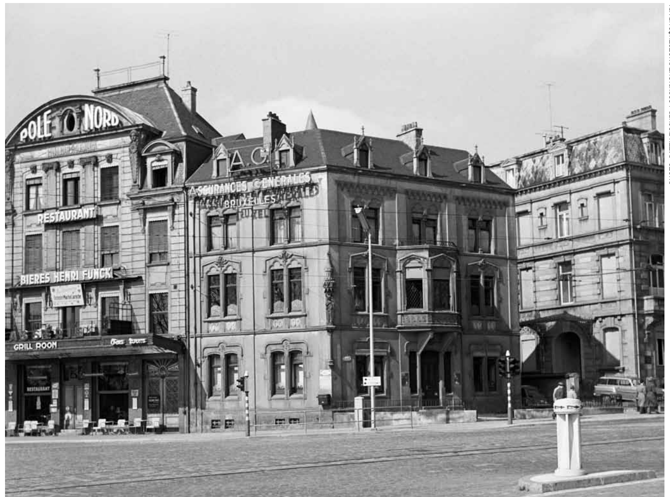
Le boulevard Royal, à travers 94 clichés pris entre 1867 et 1981 par des photographes luxembourgeois connus tels qu'Edouard Kutter, Batty Fischer ou Léon Stirn. Jusqu'au 7 septembre au « Ratskeller » du Cercle Cité.