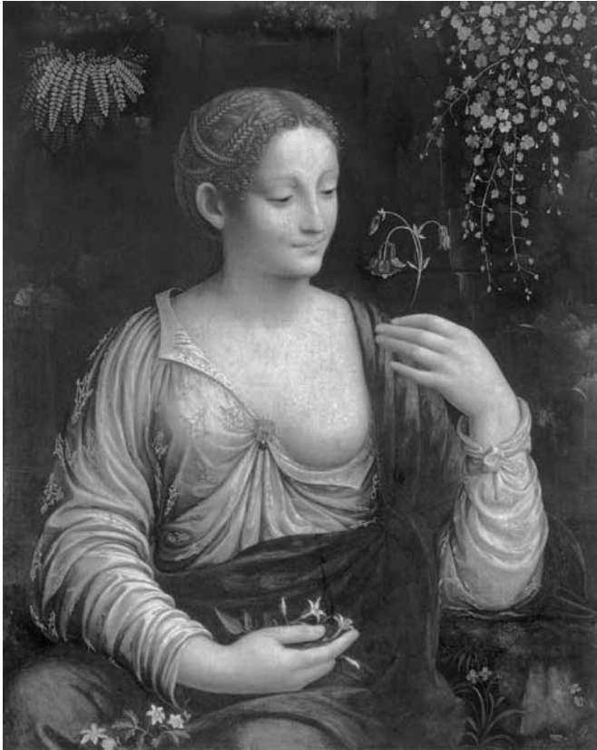
Die Flora von Melzi gehörte zu den prominentesten Werken der Sammlung Wilhelms II.