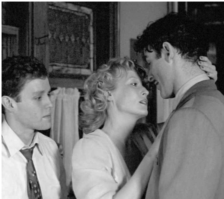
Die ehemalige KZ-Insassin Sophie und der vom Holocaust besessene Nathan führen eine zerstörerische Beziehung. „Sophie's Choice“ am 1. September um 20.30 Uhr in der Cinémathèque.

puisse résister au caractère colérique de sa fille aînée Catharina. Car d'autre part il se refuse à chercher un mari pour sa fille cadette Bianca avant d'avoir trouvé un mari pour la première des deux soeurs.