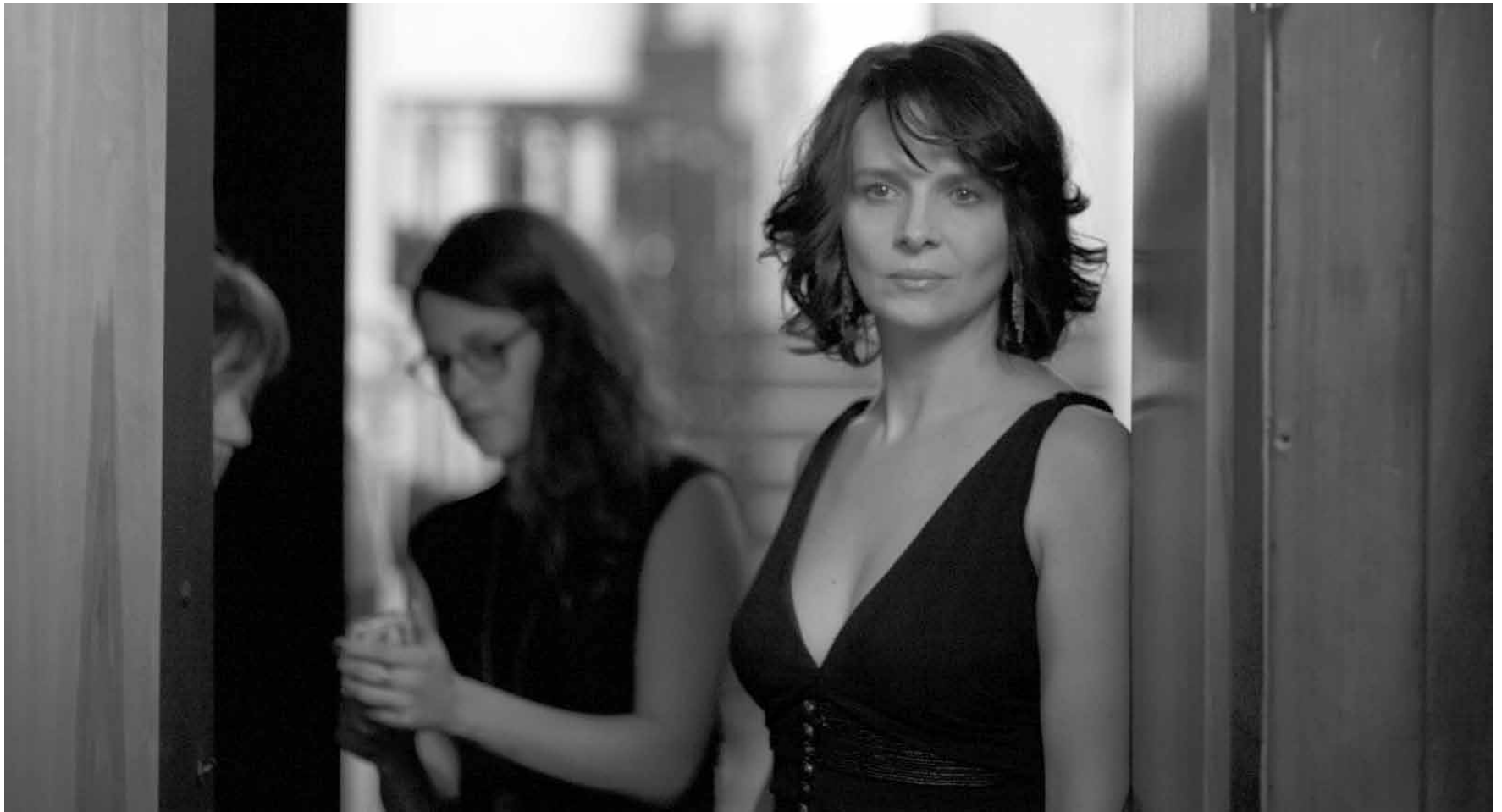
Comme les nuages qui traversent la vallée... Juliette Binoche et Kristen Stewart dans « Clouds of Sils Maria ».