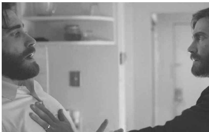
Psychothriller à la Stanley Kubrick. „Enemy“, Denis Villeneuves' erster englischsprachiger Film ist ein spannungsgeladenes Verwechslungsspiel. Neu im Utopolis Kirchberg.