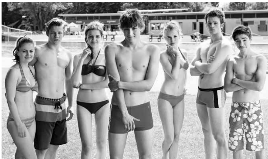
Klingt ganz nach einem deutsche Ablatsch von „Amercian Pie“ ... „Doktorspiele“ läuft im Utopolis Belval und Kirchberg.

das perfekte Foto schießen zu können auf die Jagd nach dem Hurrikan, der die vielen Tornados ausgelöst hat.