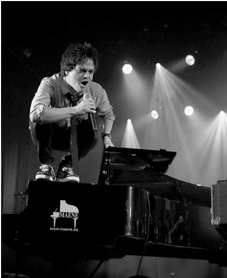
Herzensbrecher und genialer Grenzgänger zwischen Pop, Rock und Jazz.