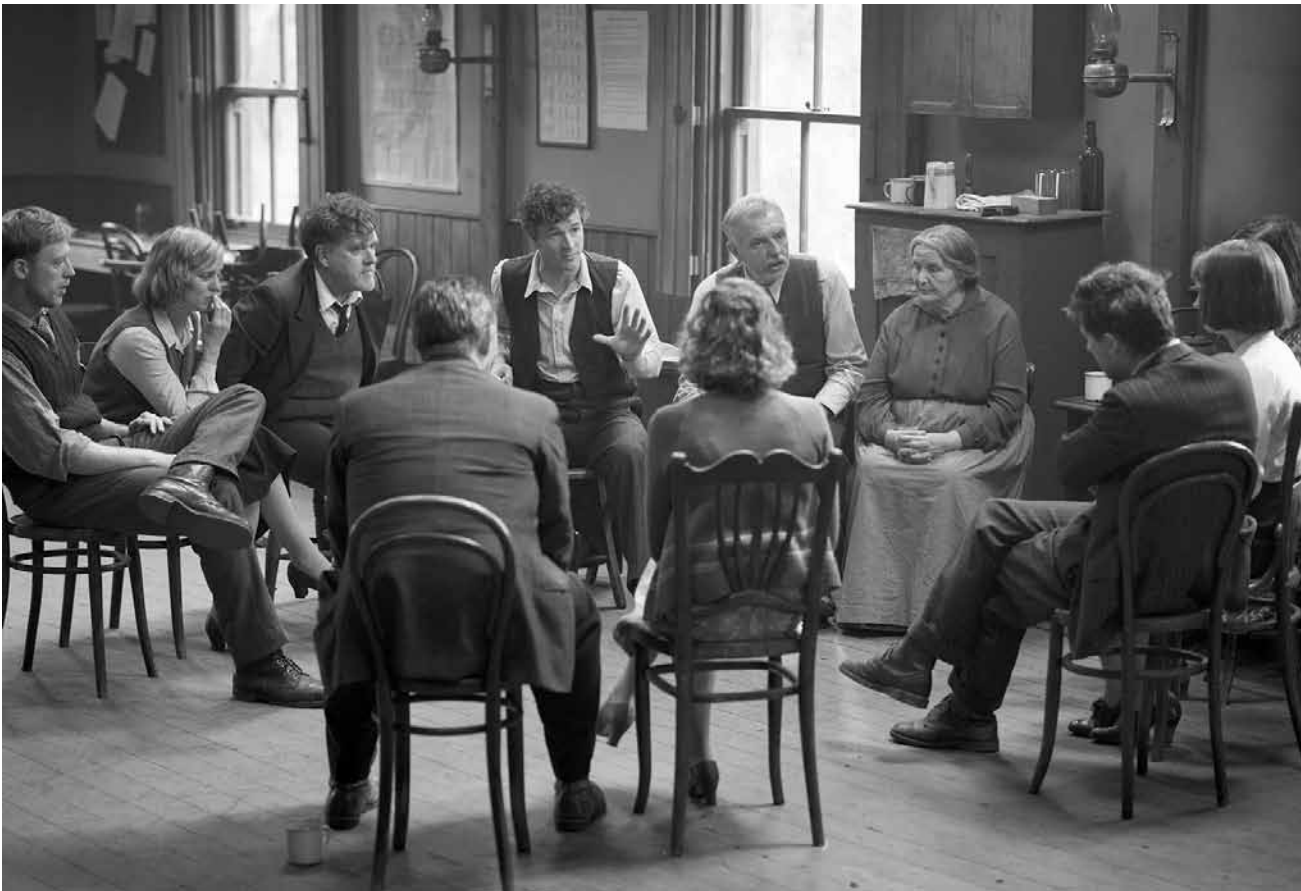
Planen nicht die Revolution, sondern wollen nur ihre Tanzhalle verteidigen.