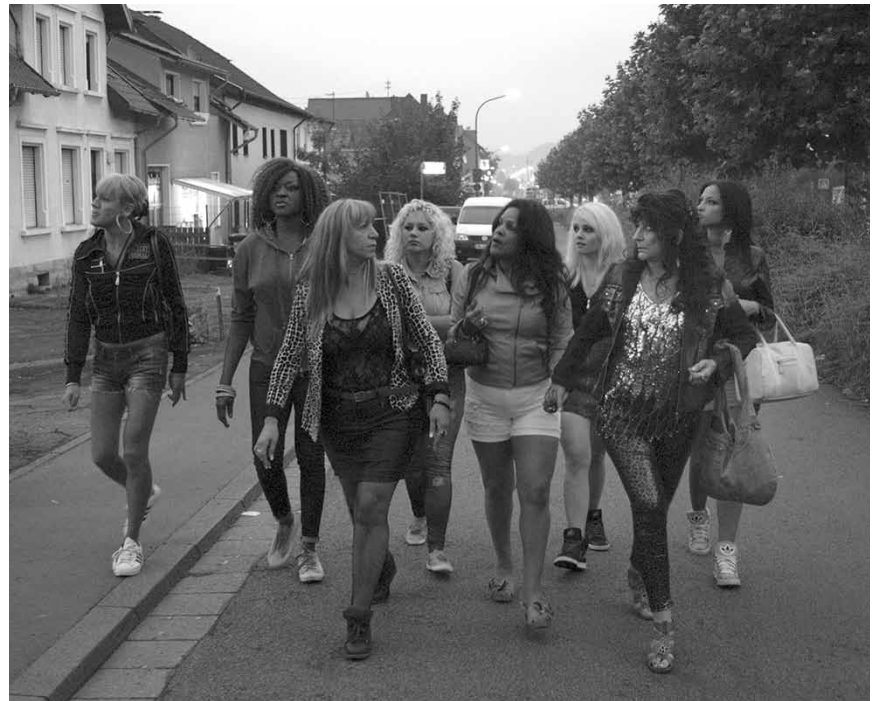
Le coeur d'une ancienne tapineuse est difficile à obtenir : « Party Girl », nouveau à l'Utopia.

XXXX = excellent XXX = bon XX = moyen X = mauvais