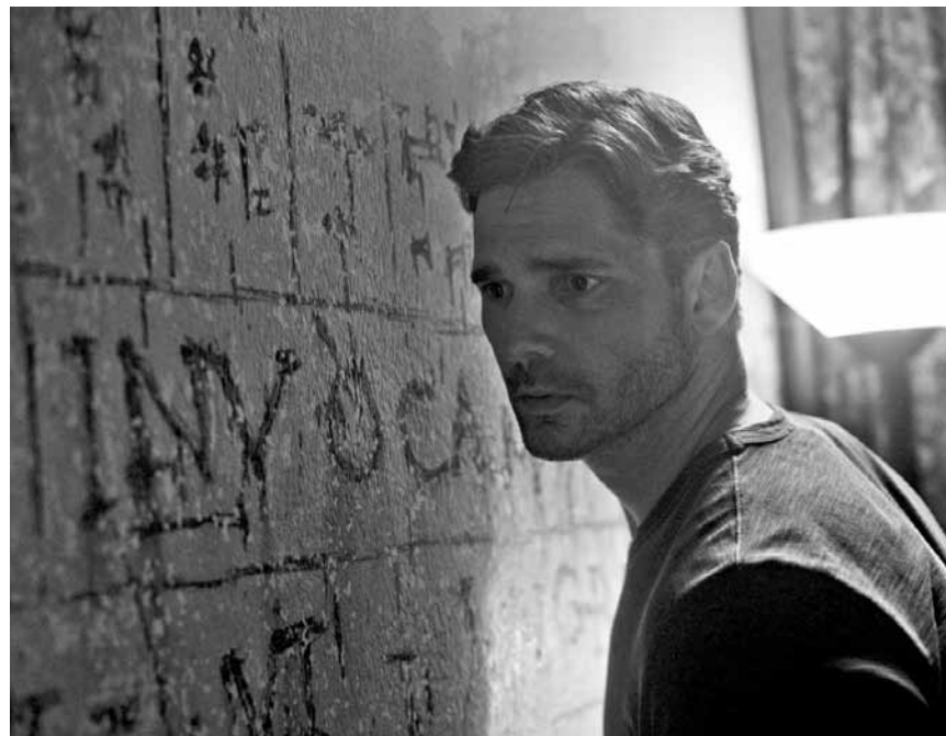
„Deliver us from Evil“ - eine Exorzismus-Story aus dem NYPD, neu im Utopolis Belval und Kirchberg.

Zehn Jahre sind vergangen, seit ein freigesetztes Virus den Großteil der Menschheit ausgerottet hat. Der übrig gebliebene Rest haust in Ruinen und lebt ein zurückgezogenes Leben im Untergrund. Eine Expedition in die Wälder, angeführt von Malcolm, trifft auf das von Caesar angeführte Affenvolk. Malcolm und Ellie erwirken ein Friedensabkommen mit Caesar, das jedoch von kurzer Dauer ist.