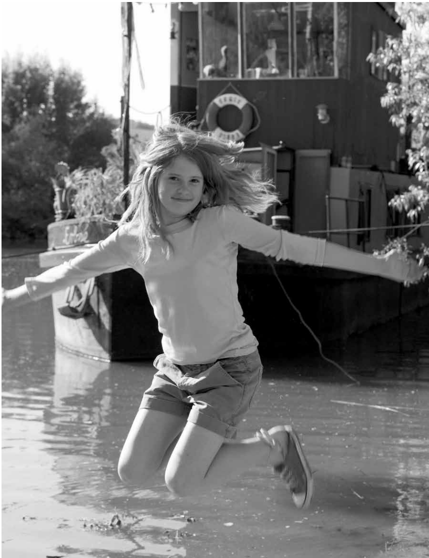
Sie ist sicher keine Prinzessin: „Lola auf der Erbse“ kann auch schon mal ungemütlich werden - neu im Utopolis Belval und Kirchberg.

père est aux abonnés absents et son collègue interne, Abdel, est un médecin étranger plus expérimenté que lui. Benjamin va se confronter brutalement à ses limites, à ses peurs, celles de ses patients, des familles, des médecins, et du personnel.