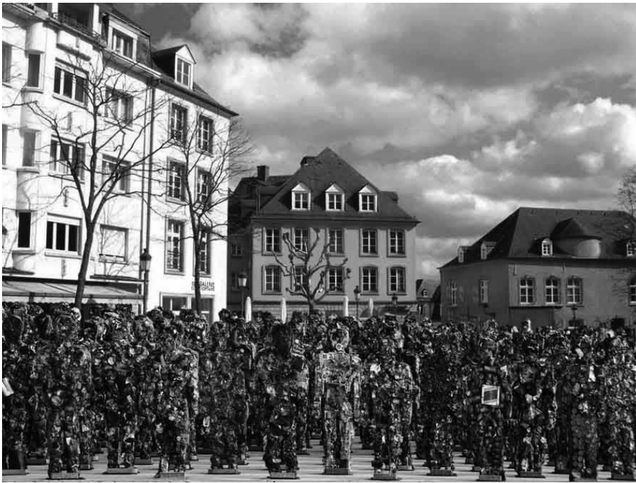
« Trash People » - synergie entre art et éducation populaire.