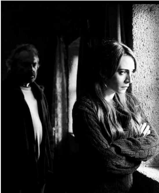
Photographie impeccable pour « Winter Sleep » dans des intérieurs somptueux.