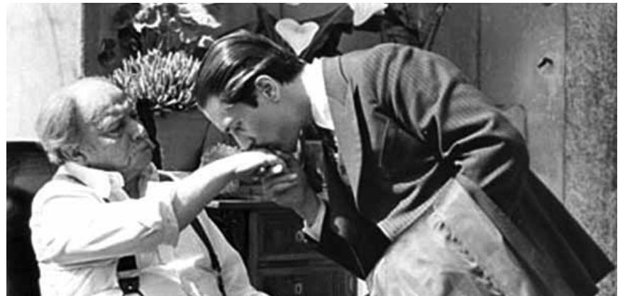
Un film qu'on ne peut pas refuser : « The Godfather : Part 2 », jeudi à la Cinémathèque.