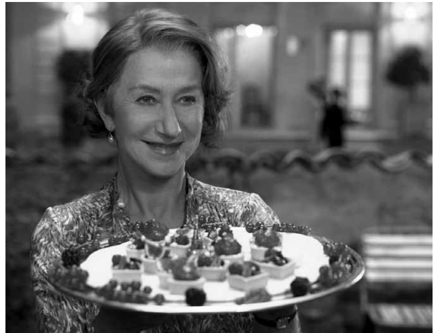
Ein indisches Restaurant eröffnet in der französischen Provinz, das ist die Voraussetzung für Lasse Halmströms „The Hundred Foot Journey“, neu im Utopolis Belval und Kirchberg.