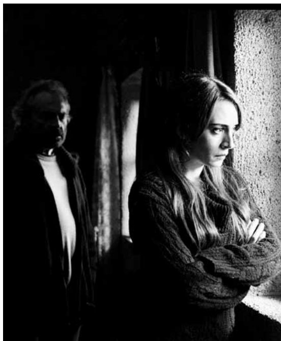
Photographie impeccable pour « Winter Sleep » dans des intérieurs somptueux.