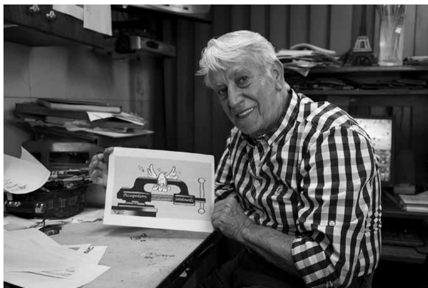
Dessine-moi la liberté... Dans « Caricaturistes - Fantassins de la démocratie », une douzaine de caricaturistes parlent de leur métier. Avant-première mardi à l'Utopolis Belval.