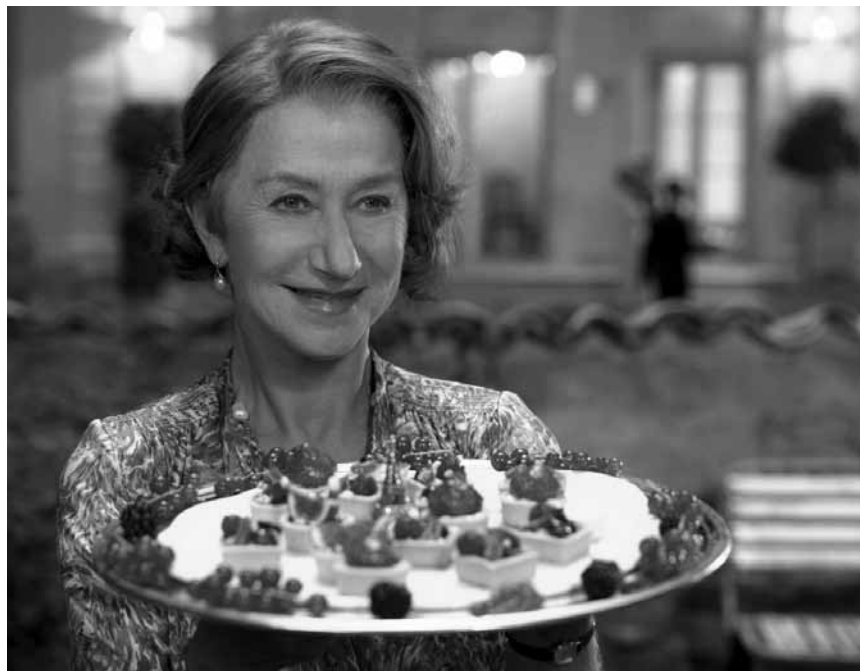
Ein indisches Restaurant eröffnet in der französischen Provinz, das ist die Voraussetzung für Lasse Halmströms „The Hundred Foot Journey“, neu im Utopolis Belval und Kirchberg.