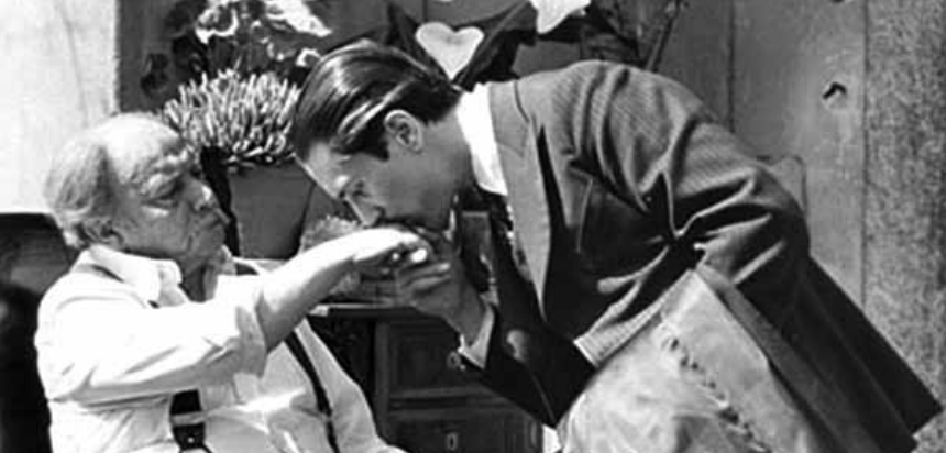
Un film qu'on ne peut pas refuser : « The Godfather : Part 2 », jeudi à la Cinémathèque.

Ein 10-jähriges Mädchen verschwindet, als es einen Tag mit ihrem alleinerziehenden Vater in der Stadt verbringt. Das vermisste Kind löst eine Kette dramatischer Ereignisse aus, in die unter anderem ein drogenabhängiger Polizist mit Allmachtsfantasien verstrickt ist. ■■■ Anurag Kashyap trace sa route depuis longtemps hors des canons de Bollywood et signe là un film sombre et haletant. Une oeuvre majeure que ne traverse cependant aucune lueur d'espoir. (ft)