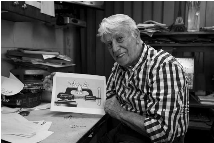
Dessine-moi la liberté... Dans « Caricaturistes - Fantassins de la démocratie », une douzaine de caricaturistes parlent de leur métier. Avant-première mardi à l'Utopolis Belval.

By Tennessee Williams. Directed by Benedict Andrews. With Gillian Anderson, Ben Foster and Vanessa Kirby. 180'.