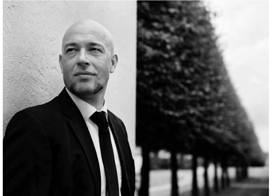
Etwas Blasphemie muss sein ... „Unheilig“ am 12. September in der Rockhal.