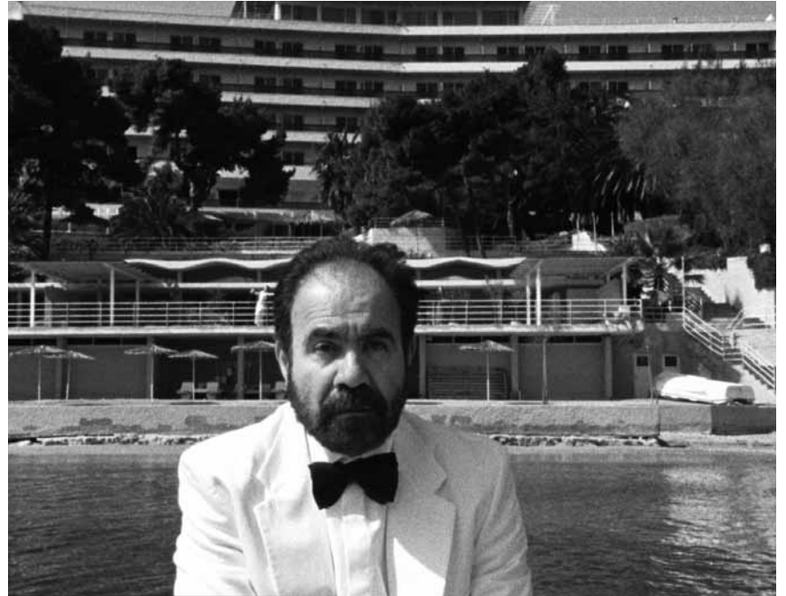
After staging his own kidnapping, Greek national television hero Antonis Paraskevas begins to lose his mind - "The Eternal Return of Antonis Paraskevas" - Tuesday at Utopia.