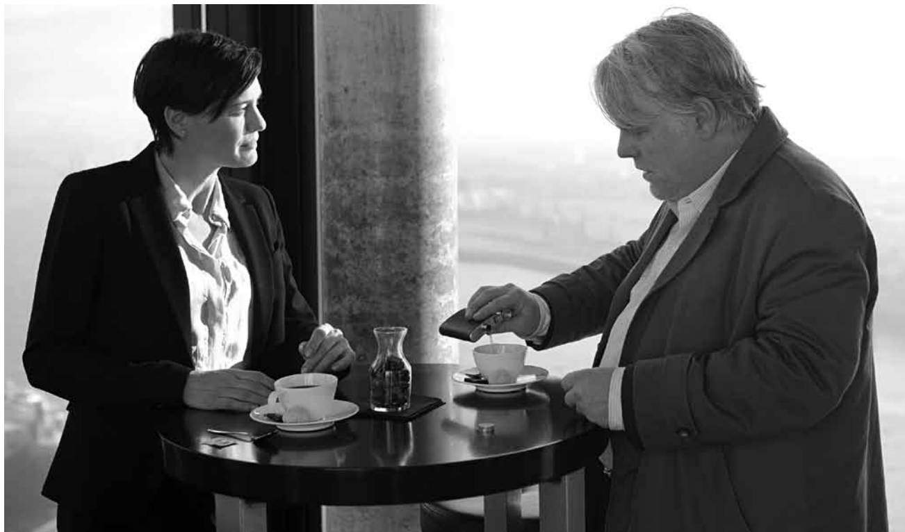
Wenn Amerikaner und Deutsche sich um einen tschetschenischen „Terroristen“ streiten wird es meistens schmutzig: „A Most Wanted Man“ - neu im Utopolis Kirchberg.