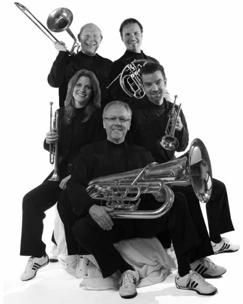
Tabernacle ! Le « Canadian Brass Band » débarquera au Trifolion d'Echternach, ce vendredi 19 septembre.