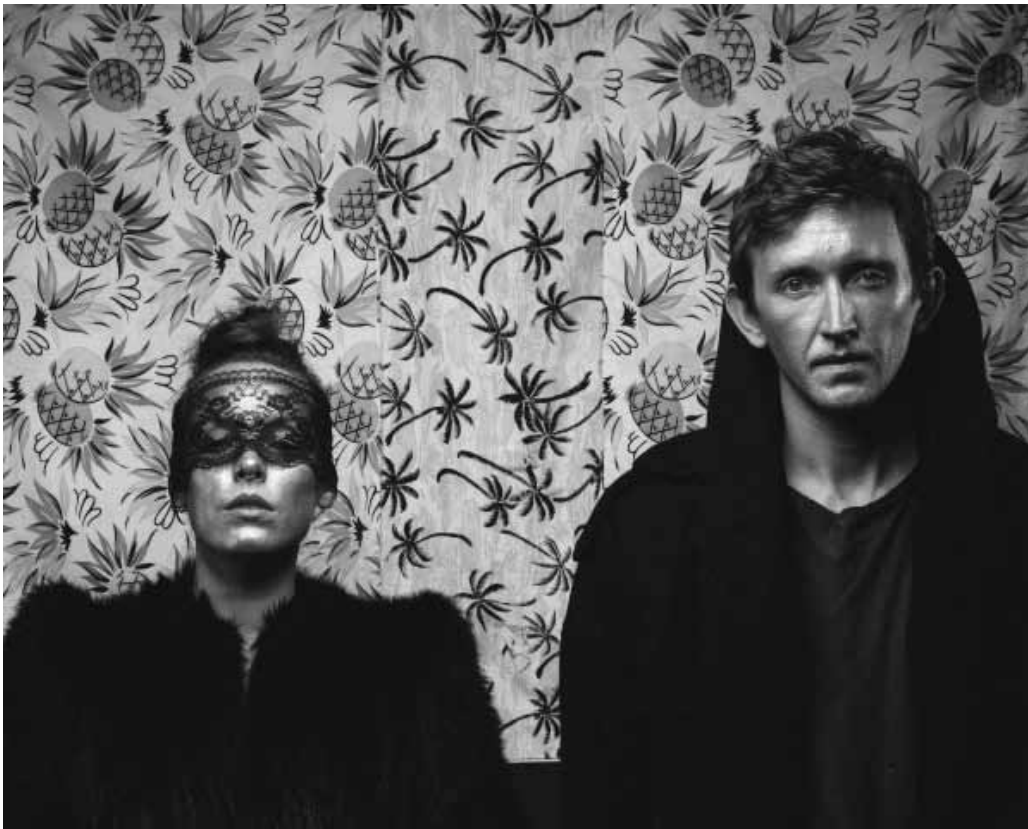
Ils ne voulaient pas être un groupe au début : Sylvan Esso.