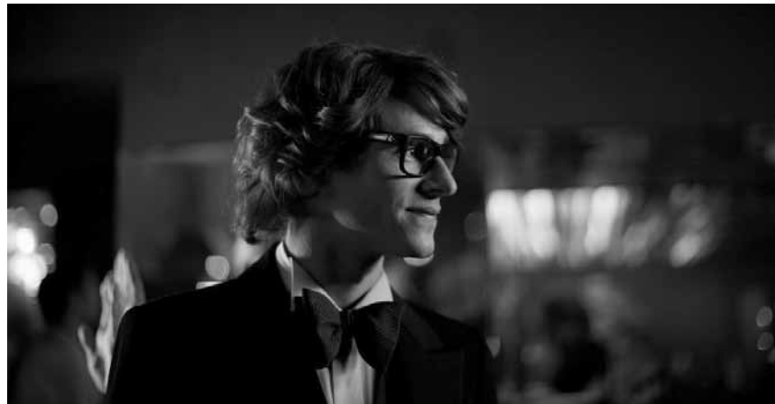
Espérons que cette fois-ci le film sera taillé sur mesure : « Saint Laurent », le deuxième biopic sur le légendaire créateur de mode, nouveau à l'Utopia.

Entre ses potes et l'entreprise familiale, l'été d'Arnaud s'annonce tranquille... jusqu'à sa rencontre avec Madeleine, aussi belle que cassante, bloc de muscles tendus et de prophéties catastrophiques. Il ne