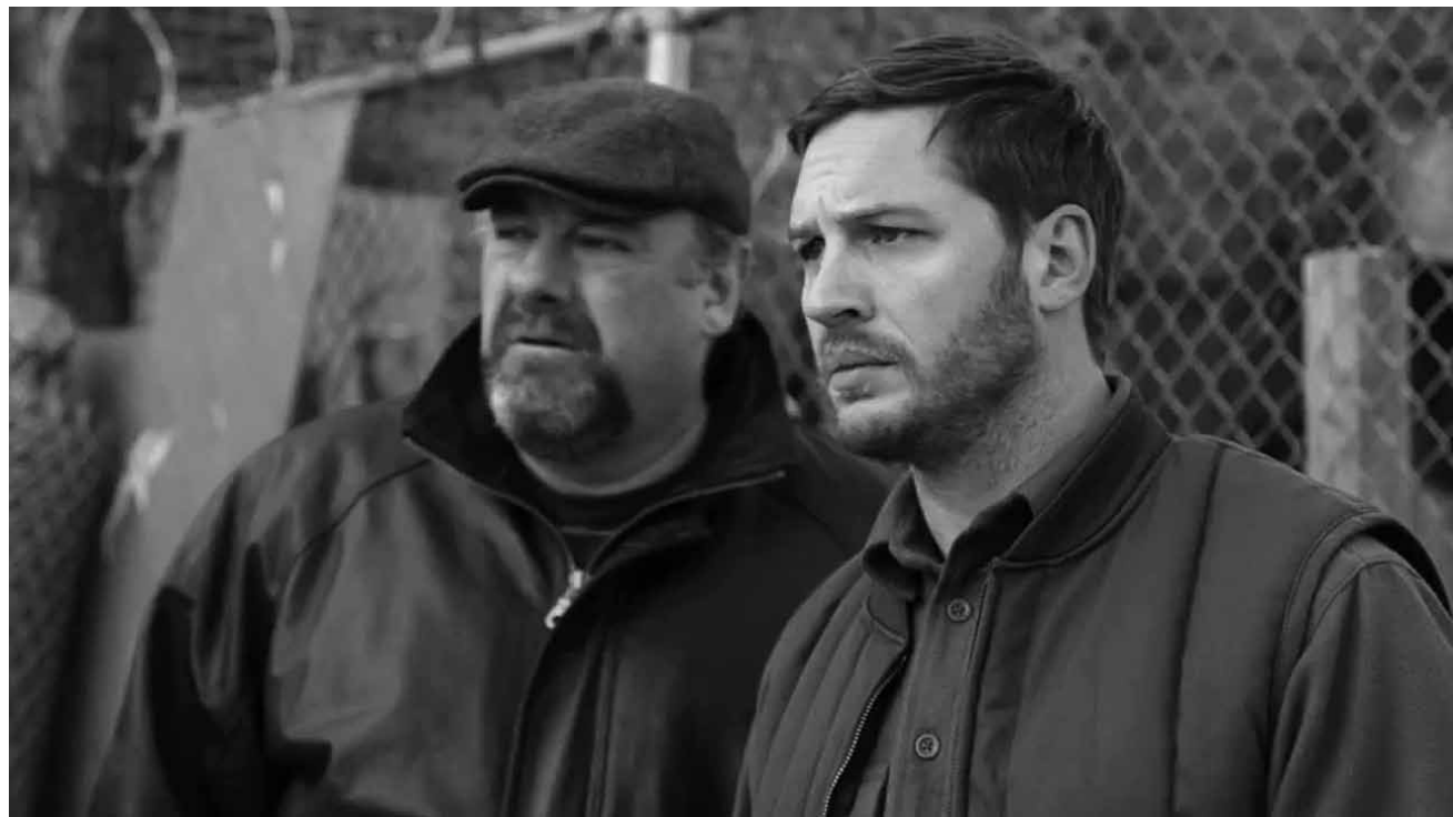
In „The Drop“ geht es um den berühmten Tropfen der das Fass zum Überlaufen bringt - neu im Utopolis Belval und Kirchberg.

*** Un film comme on voudrait en voir plus : loin du parisianisme, loin des grandiloquences germonapratines et de leurs envolées lyriques. Un film simple, sur des gens simples mais qui - en fin de compte - en dit tellement plus sur la vie. (lc)