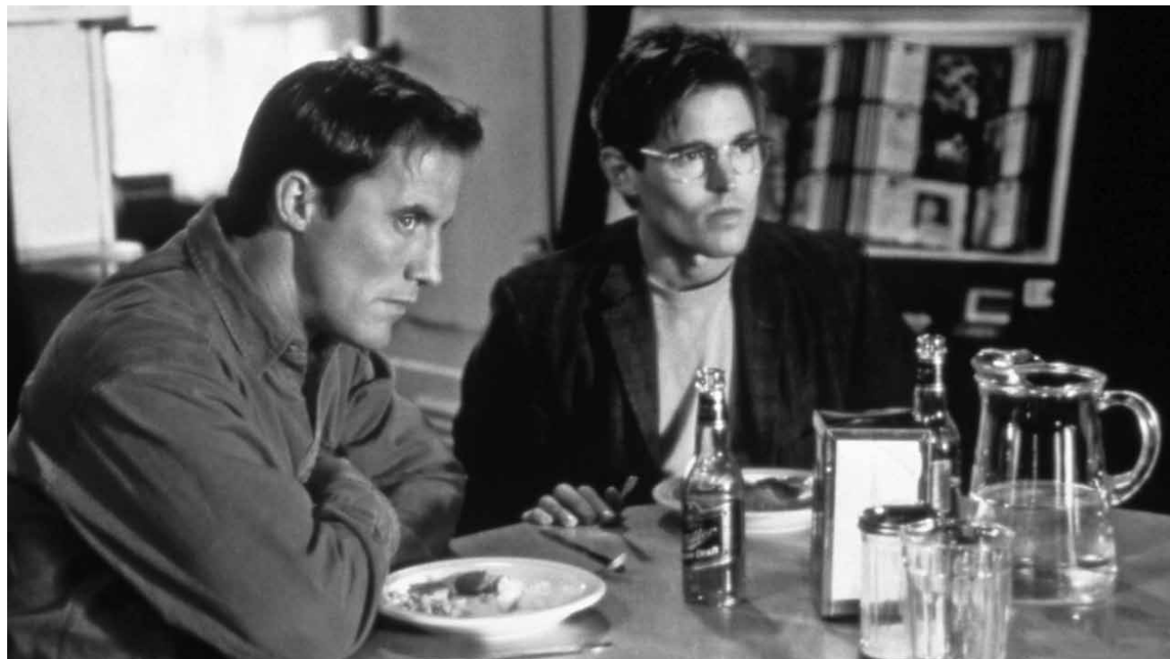
Deux frères que tout oppose à la recherche de leur père disparu : « Simple Men », de Hal Hartley, lundi à la Cinémathèque.

Chicago, au temps de la prohibition. Un petit malfrat, l'ambitieux Tony Camonte, tue son patron et devient le garde du corps de Lovo, chef du gang rival. Amoureux de Poppy, la petite amie de Lovo, il veille jalousement sur sa soeur Cesca, lui interdisant toute liaison sentimentale. Avec son complice Guido Rinaldo, Tony prend peu à peu le pouvoir au sein du gang de Lovo.