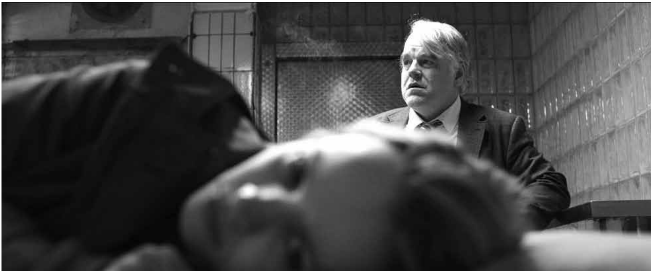
Le regretté Philip Seymour Hoffman dans un de ses derniers rôles - même s'il disparaît constamment derrière un écran de fumée de cigarette, sa performance à elle seule vaut le coup d'aller voir « A Most Wanted Man ».