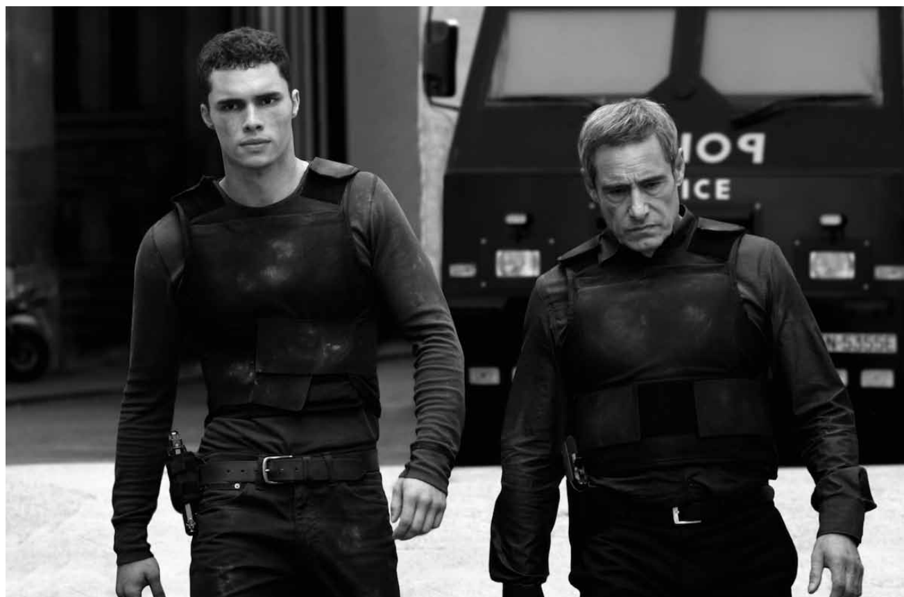
« Colt 45 » est un film d'un certain calibre... plutôt dur - nouveau à l'Utopolis Kirchberg.

Ciné Waasserhaus, So. 17h45 (dt. Fass.).