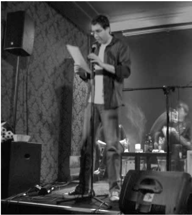
Die Stamm-Mann- (und Frau)schaft in voller Aktion.