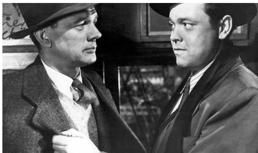
Un classique du film noir à ne pas rater ! Ce thriller psychologique de Carol Reed se déroule à Vienne en 1948. « The Third Man » - lundi 13 octobre à la Cinémathèque.

Mateus liebt die Sterne. Oft lehnt er nachts am Fenster und blickt in die Tiefen des Universums. Und immer stellt er sich die eine Frage: „Wie kann ich den anderen zeigen, dass ich nicht zurückgeblieben bin? Wie kann ich beweisen, dass ich fühle und denke wie jeder andere?“ Mateus leidet unter einer zerebralen Bewegungsstörung und ist nicht im Stande seinen Körper zu kontrollieren. Obwohl er nicht mit seiner Umwelt kommunizieren kann, nimmt er doch alles um sich herum wahr: Die abstoßenden Bemerkungen seiner Schwester. Das Lächeln der wunderschönen Anka. Die liebevolle Fürsorge seiner Mutter. Und die üppigen Brüste der netten Nachbarin. Doch der Tag wird kommen, an dem er es allen zeigen wird.