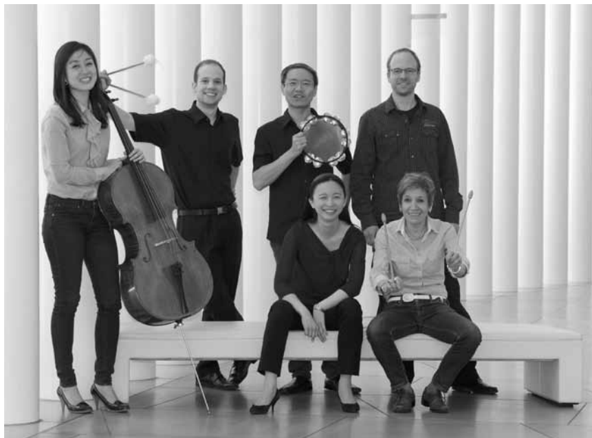
Du classique de luxe : l'Ensemble de percussions de l'OPL et son trio de pianos feront trembler les murs de la Schungfabrik à Tétange le 19 octobre.

Arsen und Spitzenhäubchen , von Joseph Kesselring, Tufa, Kleiner Saal, Trier (D), 20h. Tél. 0049 651 7 18 24 12.