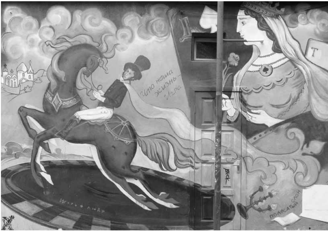
Graffiti représentant Pouchkine et la dame de pique.