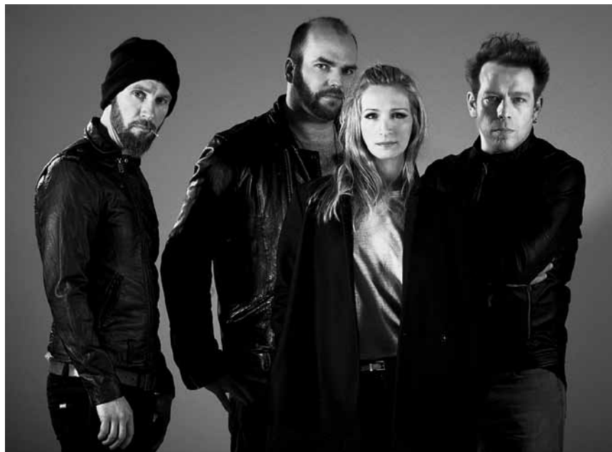
Definitiv mehr als schwäbischer Rock: Die Göttinger Kult-Band Guano Apes spielt an diesem Samstag, dem 25. Oktober im hauptstädtischen Atelier.

Guano Apes + Mean to You , Den Atelier, Luxembourg , 21h. www.atelier.lu