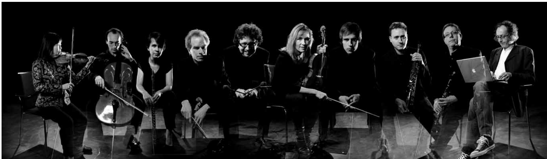
Ils se produiront dans le cadre du festival multidisciplinaire « Stille Kunst » : United Instruments of Lucilin, le 2 novembre au CCRN.