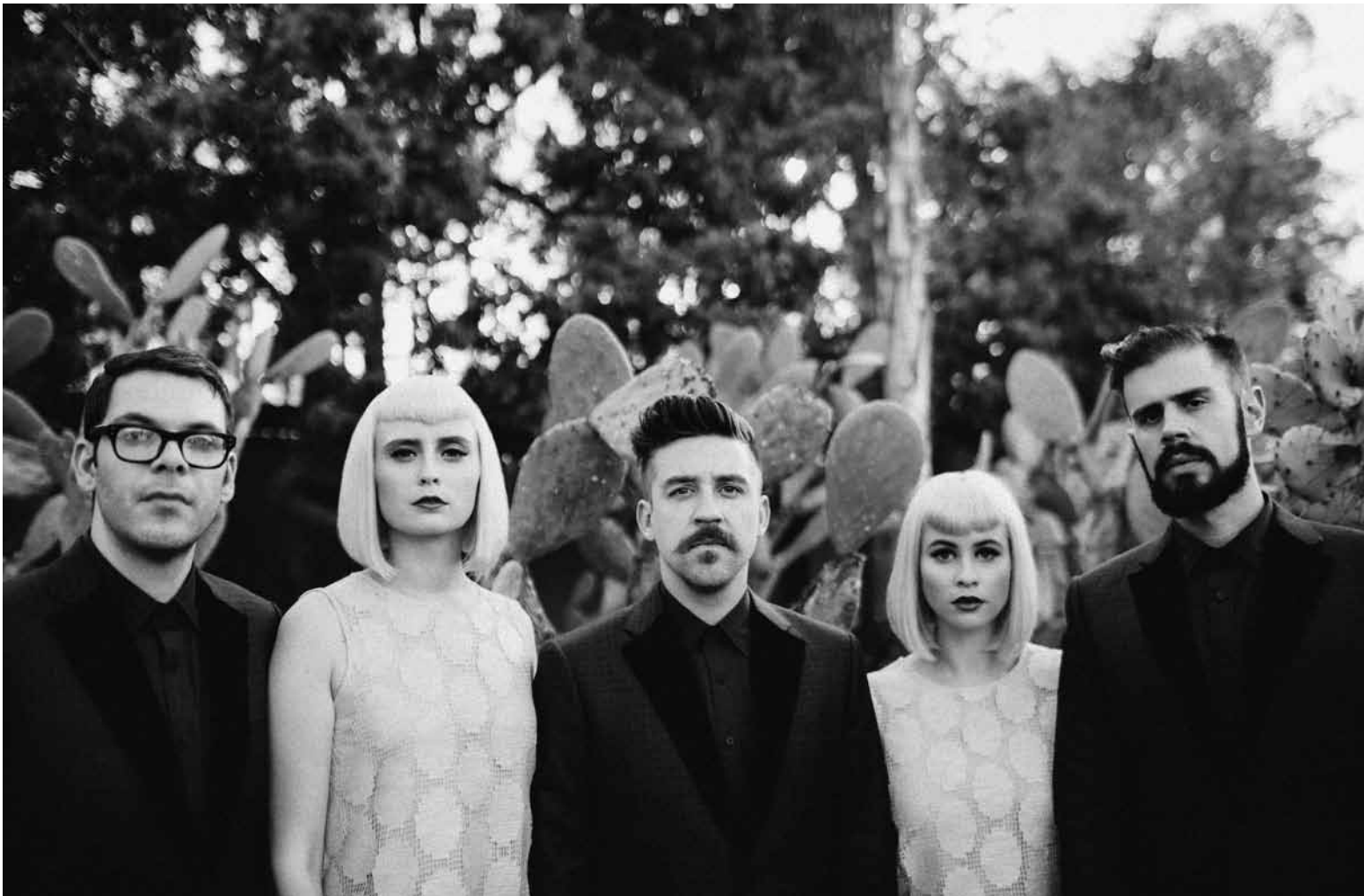
Symmetrie als Verkaufsargument: Lucius.