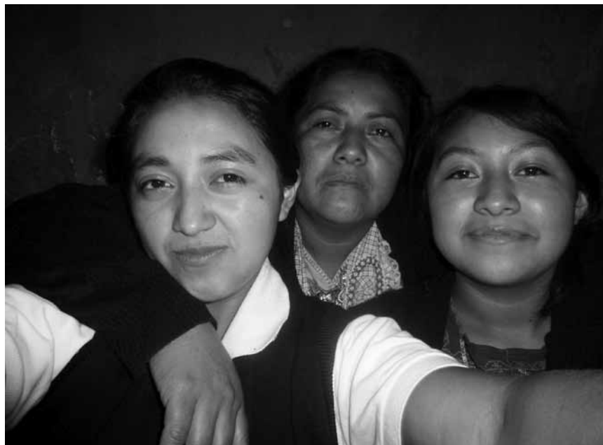
Consommation controversée : « Madre Mia » réunit 45 photographes et dépeint la discrimination et la misère dont sont victimes les femmes issues des milieux ruraux du Guatemala. Jusqu'au 15 novembre à la « Belle Etoile » et à partir du 17 novembre à la Gare.