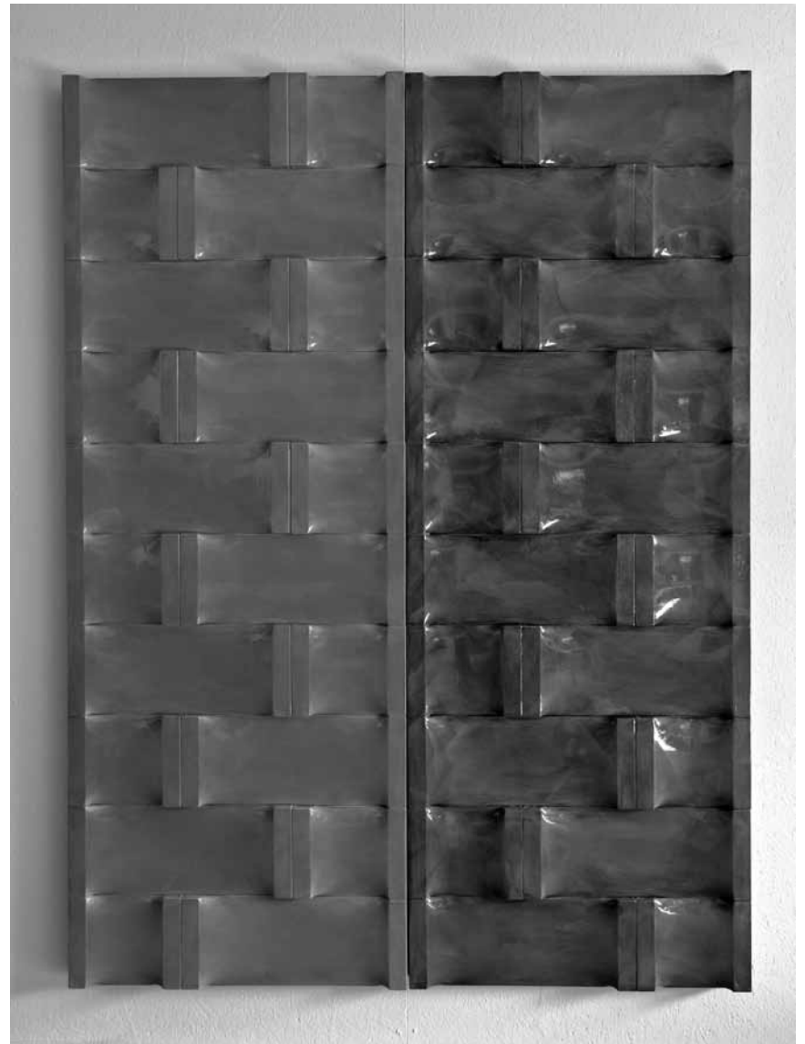
Gemalte und architektonische Symbiose: Der Luxemburger Roland Quetsch spielt in seiner Ausstellung „I“ mit strukturellen Gegensätzen. Vom 20. November bis zum 4. Januar im Künstlerhaus Saarbrücken.

Eröffnung an diesem Sonntag 16.11. um 11h.