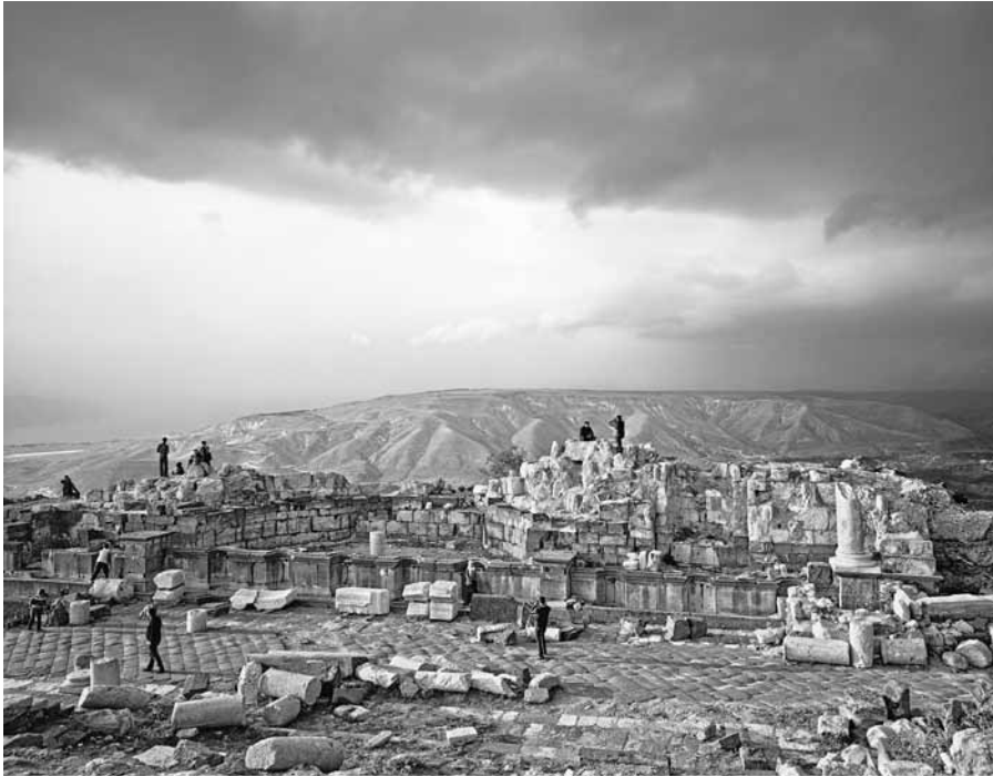
Auf den Spuren des alten Roms: Um Qais, Gadara, Jordanien - Aus der Ausstellung „Imperium Romanum“.