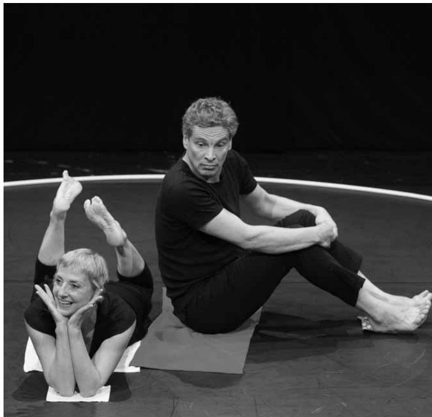
Le b.a.-ba de l'expansion : la pièce pour enfants « Le grand rond » de l'ensemble bruxellois La Berluë raconte l'histoire de deux personnages qui veulent s'approprier un espace. Les 20, 22, 23 et 25 novembre au Carré Rotondes.

Manufaktur Dieudonné , Führung durch die Ausstellung, Luxemburger Druck- und Spielkartenmuseum, Grevenmacher , 14h30 + 16h. Tel. 26 74 64-1.