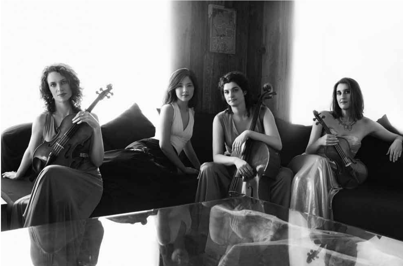
Le Cecilia String Quartet joue la musique classique dans toute sa splendeur avec des oeuvres de Beethoven, Curcin et Tchaïkovski - le samedi 29 novembre au conservatoire d'Esch.

The Valley of Astonishment , theatrical research by Peter Brook and Marie-Hélène Estienne, Grand Théâtre, Luxembourg, 20h. Tél. 47 08 95-1.