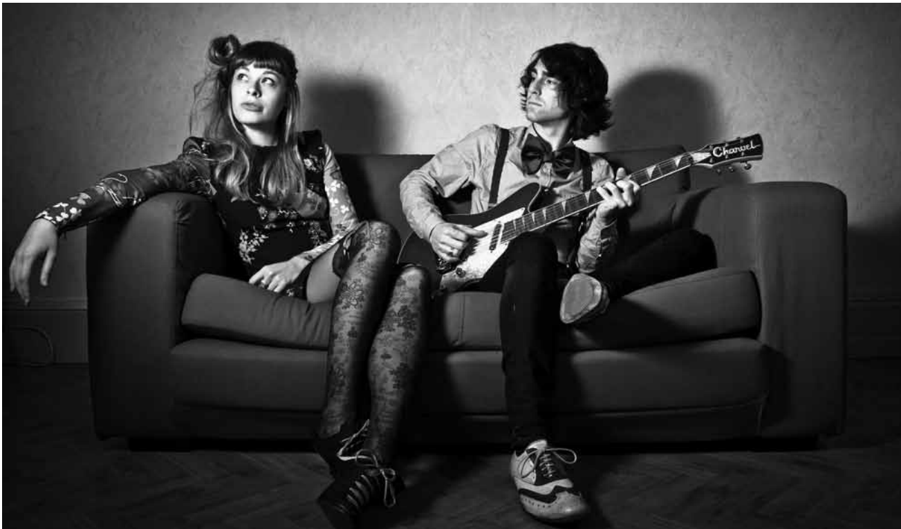
Présentés par le réseau grand-régional Multipistes : les Nancéens de Luna Gritt proposent un mélange entre pop, rock et soul.