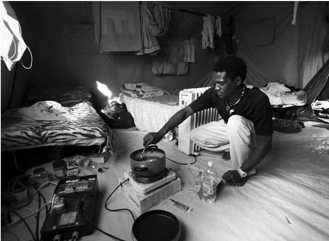
Wer in einem solchen Zelt unterkommt, hat Glück gehabt.