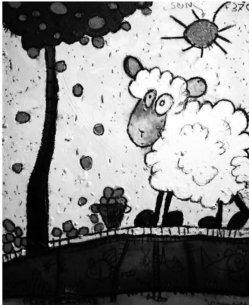
Technicien spécialisé, Joël Meiers explore aussi bien les couleurs que les procédés dans ses peintures - encore jusqu'au 14 décembre à l'Ancien Cinéma à Vianden.

espace H2O (rue Rattem), jusqu'au 4.1.2015, me. - di. 15h - 19h.