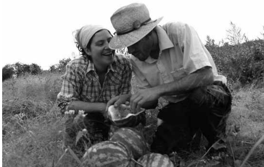
Une nouvelle génération de fermières et de fermiers peut-elle être formée à partir de la glèbe ? Le documentaire « To Make a Farm » relate l'expérience canadienne - mardi à l'Utopia, projection suivie d'un débat.