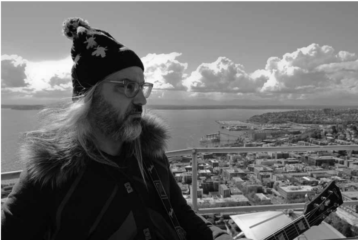
Indie-Rockfans sollten sich schon mal warm anziehen für J. Mascis.