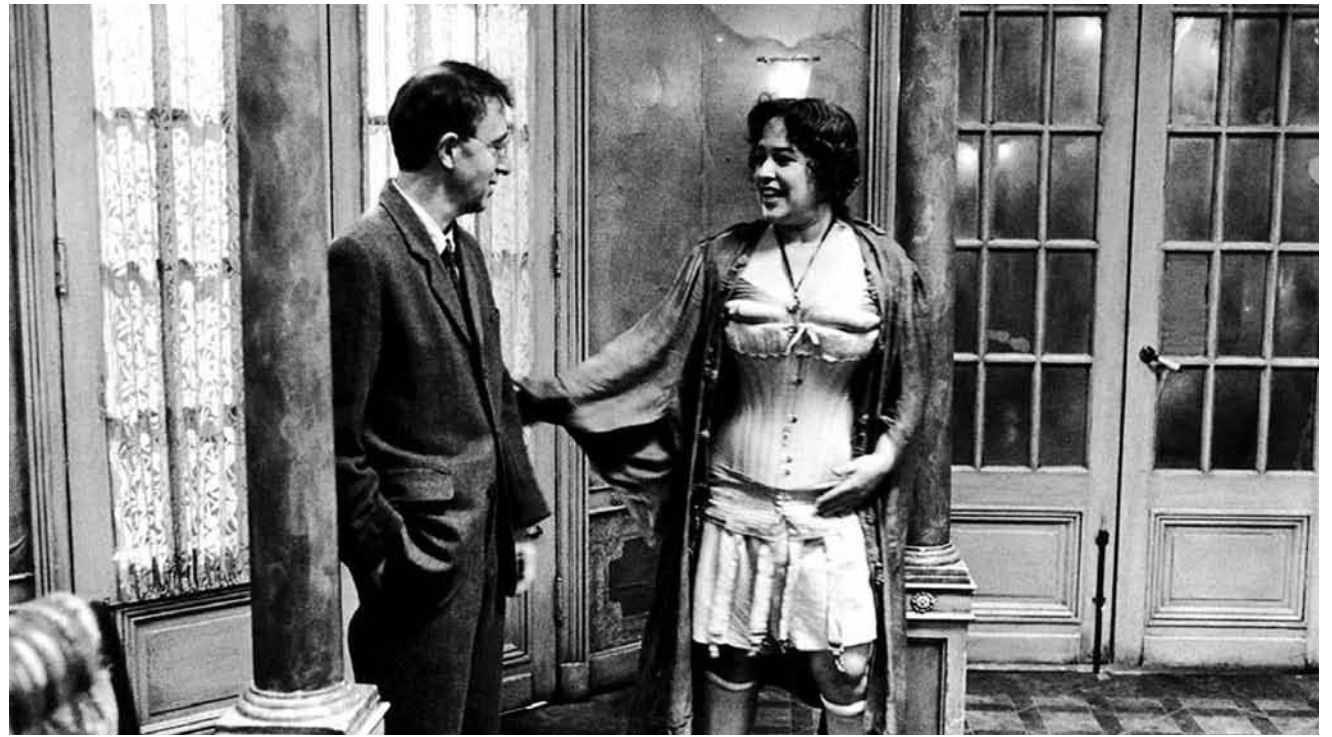
Une vraie rareté : dans « Shadows and Fog » de 1991, Woody Allen fait renaître les années 1920, mercredi à la Cinémathèque.

Elevés ensemble, Cathy et Heathcliff s'aiment. Mais les circonstances amènent Cathy à épouser, au lieu du sauvage Heathcliff, le vrai gentleman qu'est Edgar Linton. Heathcliff, revenu riche d'Amérique, se marie à son tour,