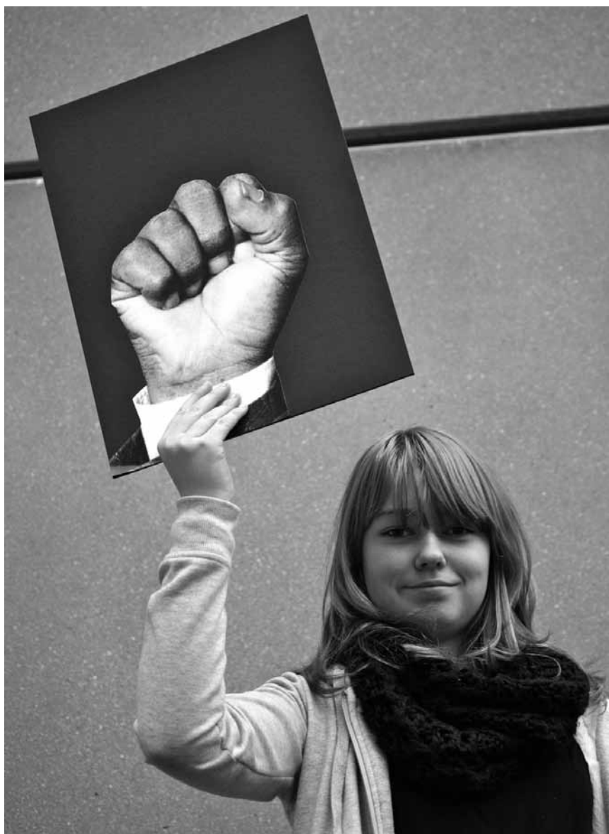
... die gute Sache: „Kunst im Kasten: Nelson Mandela“ - bis zum 14. März 2015.