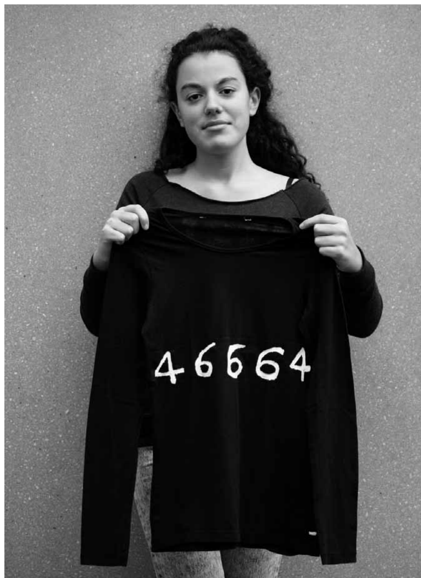
Kunst im „Nonnebunker“? Die Schülerinnen der Escher „Ecole privée Marie Consolatrice“ zeigen Engagement für ...