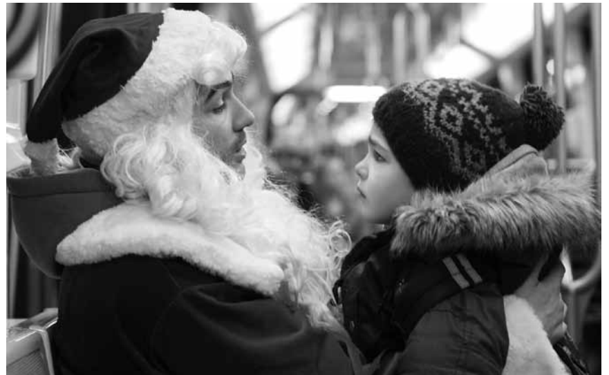
Cette fois « Le père Noël » est plus qu'une ordure, c'est carrément un cambrioleur... le conte de Noël de la saison est à voir aux Utopolis Belval et Kirchberg.

Die unter den Straßen der Stadt Cheesebridge hausenden Boxtrolls werden von den menschlichen Bewohnern der Oberfläche gefürchtet. Da die in Pappkartons lebenden Monster nur nachts ihre unterirdische Heimat verlassen, ranken sich viele Schauergeschichten um sie, die von dem verschlagenen Archibald Snatcher befeuert werden.