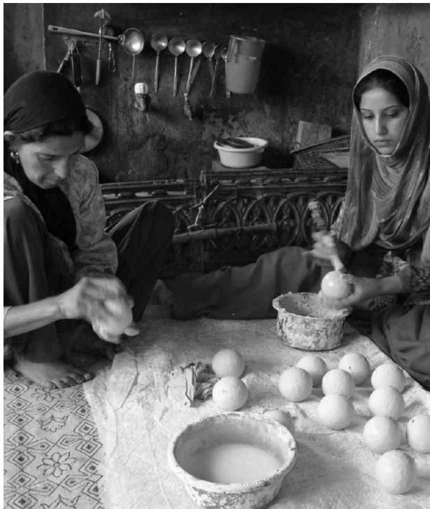
„Von Indien auf unseren Weihnachtsbaum“ - ein Workshop für Kinder zum Thema gerechter Handel, an diesem Samstag, dem 13. Dezember im Citim.

De bloen Hary , vum Emile Boeres, Theatersall (rue Jean Gallion), Oberkorn , 18h.