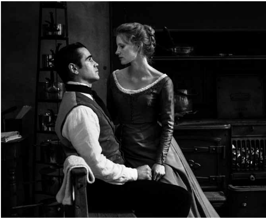
„Miss Julie“ - nach dem Roman von August Strindberg ist eine düstere Geschichte über Liebe, Klassengesellschaft und Passion - neu im Utopia.

Leben: Neben seiner Kunst der Landschaftsmalerei widmet er sich Reisen, Bordellbesuchen und Zusammenkünften mit dem Landadel. Der Künstler kostet seine Freiheiten aus, an der Londoner Royal Academy of Arts tritt er sehr großspurig auf. Er ist alles andere als diplomatisch und mit seinem eigenwilligen Verhalten stößt Turner so manches Mitglied der ehrenwerten Gesellschaft vor den Kopf. Und auch im Privatleben ist der Umgang mit dem kauzigen Maler überaus schwierig.