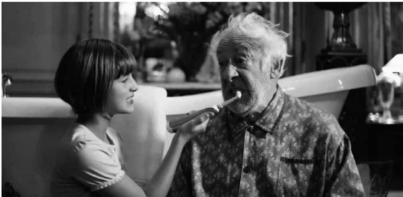
Pünktlich wie das Christkind: Til Schweigers neueste Schmonzette über das Älterwerden „Honig im Kopf“ - neu in den Kinos.

En documentaire iwwer d'Liewen vum Grand-Duc Jean, mat Archivmaterial an deelweis nach ni gewisene Biller.