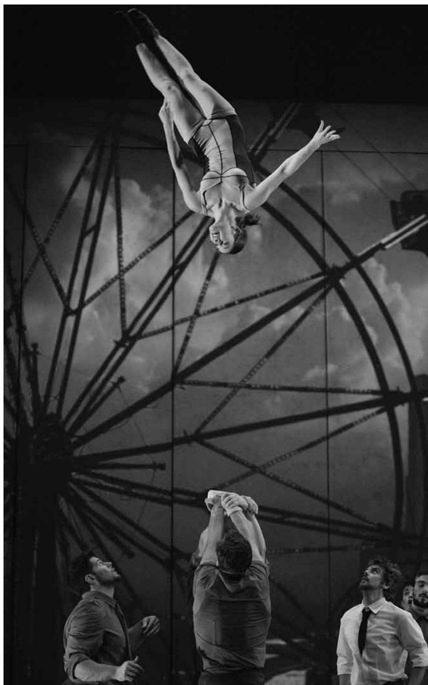
Le cirque qui venait du froid... La troupe canadienne du « Cirque Eloize » sera au Grand Théâtre les 30 et 31 décembre et les 2 et 3 janvier - garanti sans animaux.

Der kleine Prinz , Theater nach Antoine de Saint-Exupéry, sparte4