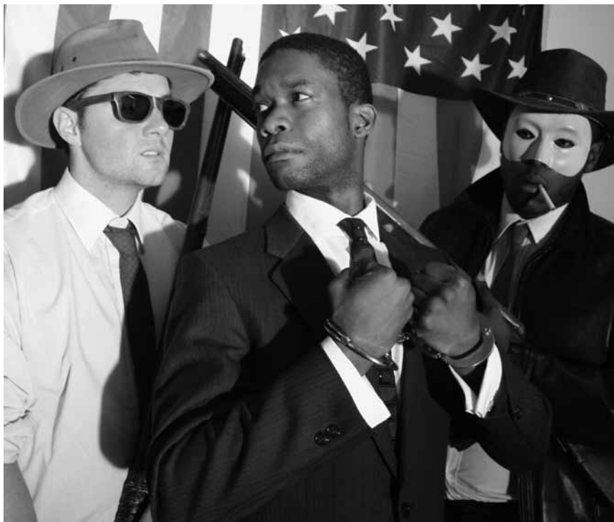
Ein Stück über den letzten Tag im Leben des Martin Luther King: „American Dreams & Nightmares“ - am 26. und 27. Januar im Neimënster.

Orchestre de Chambre du Luxembourg , sous la direction de David Reiland, oeuvres de Mozart et Tchaïkovski, Philharmonie, salle de musique de chambre, Luxembourg , 17h. Tél. 26 32 26 32.