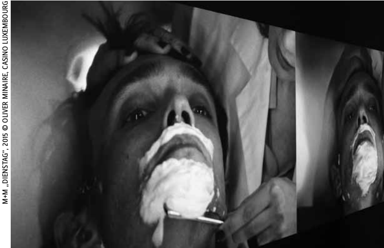
M+M „DIENSTAG“, 2015