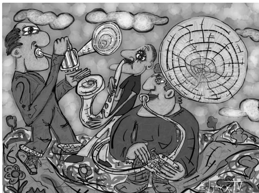
„Mega Blech“ spielen mat vier Blasinstrumenter eng flott musikalesch Geschicht fir Kanner. Den 1. Mäerz am Aalt Stadhaus zu Déifferdeng.