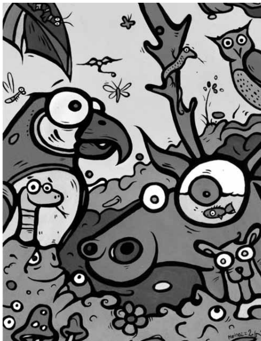
Pas naïf mais optimiste, le monde animal que l'artiste d'origine Marinazz a créé pour une exposition au Parc merveilleux de Bettembourg. À partir du 28 mars.