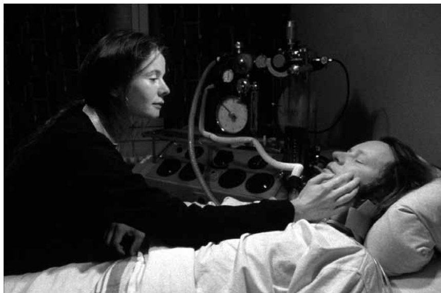
Der Film der Lars von Trier mit einem Schlag berühmt - und salonfähig - machte: „Breaking the Waves“, am Freitag in der Cinémathèque.