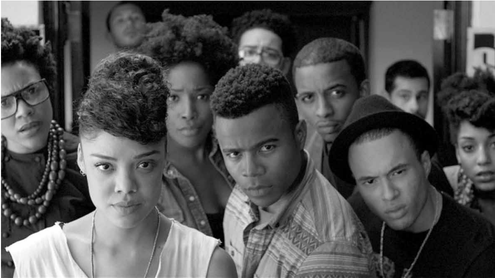
Une satire acerbe qui n'épargne personne.