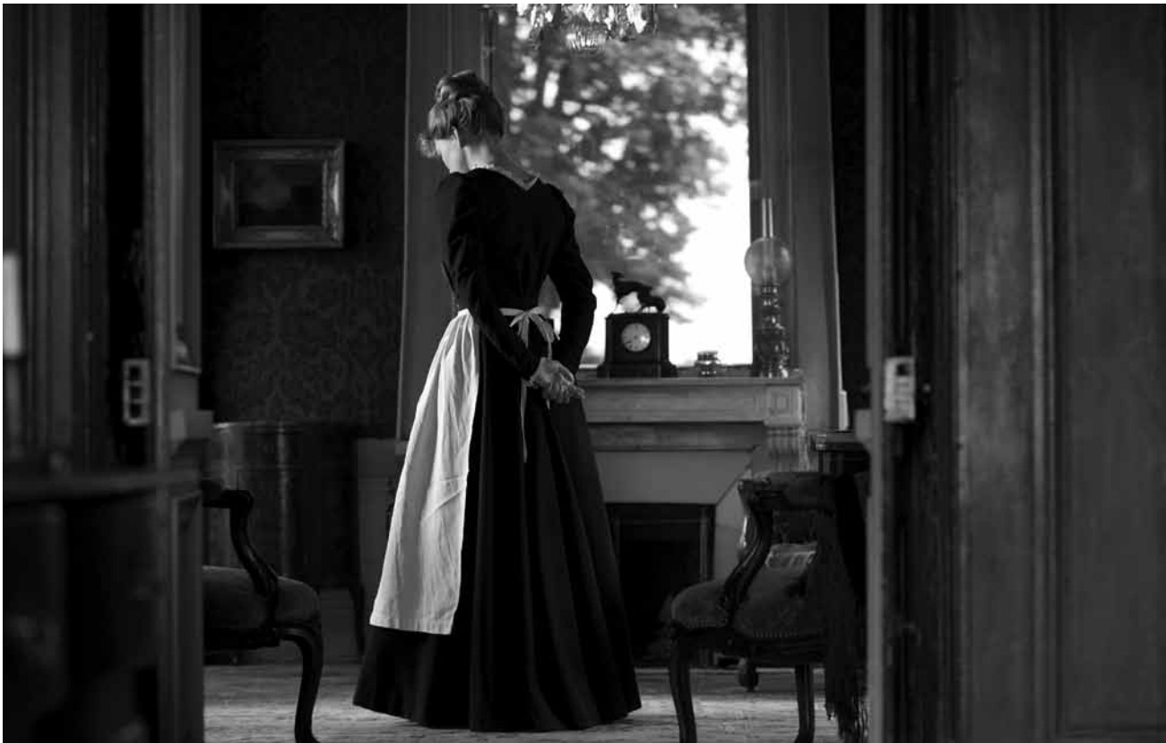
D'après le roman d'Octave Mirbeau : « Le journal d'une femme de chambre » - version 2015 de Benoît Jacquot de ce drame sur fond de province et de désirs sexuels inavouables, à l'Utopia.