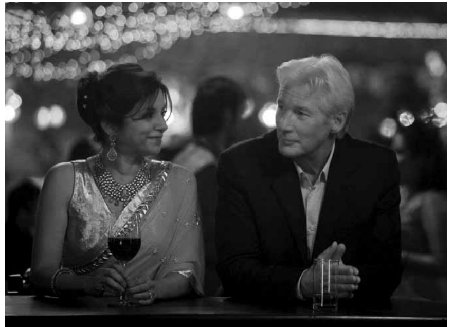
Fortsetzung der Wohlfühlkomödie über britische Rentner im - vielleicht nicht doch so - postkolonialen Indien: „The Second Best Marigold Hotel“ - neu im Utopolis Kirchberg.

Ariston, Ciné Ermesinde, Ciné Waasserhaus, Cinémaacher, Kursaal, Le Paris, Orion, Prabbeli, Scala,