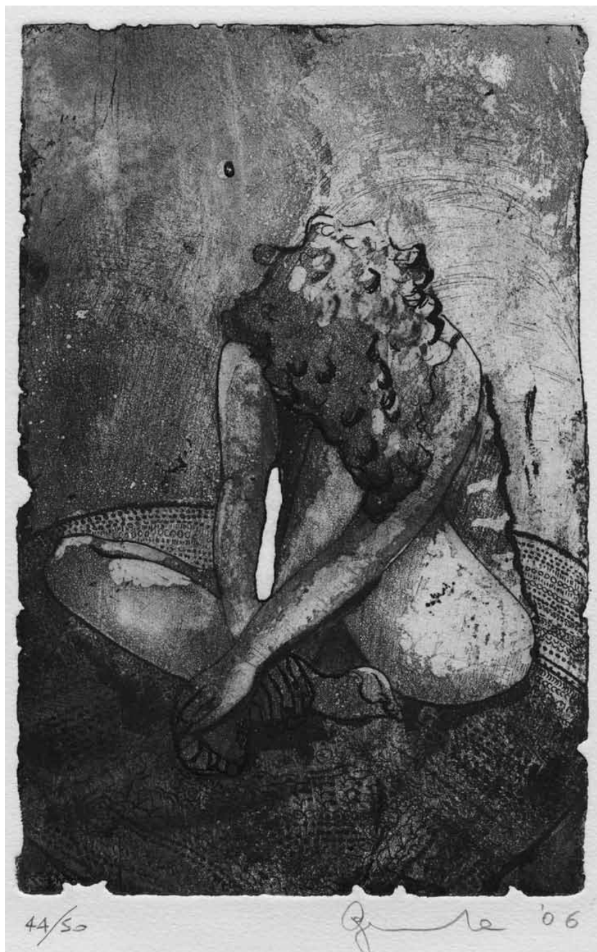
Entre modernité et tradition, l'exposition « Nu » regroupe 70 œuvres venues de trois continents sur le thème de la nudité. Jusqu'au 15 novembre à l'espace Beau Site d'Arlon.