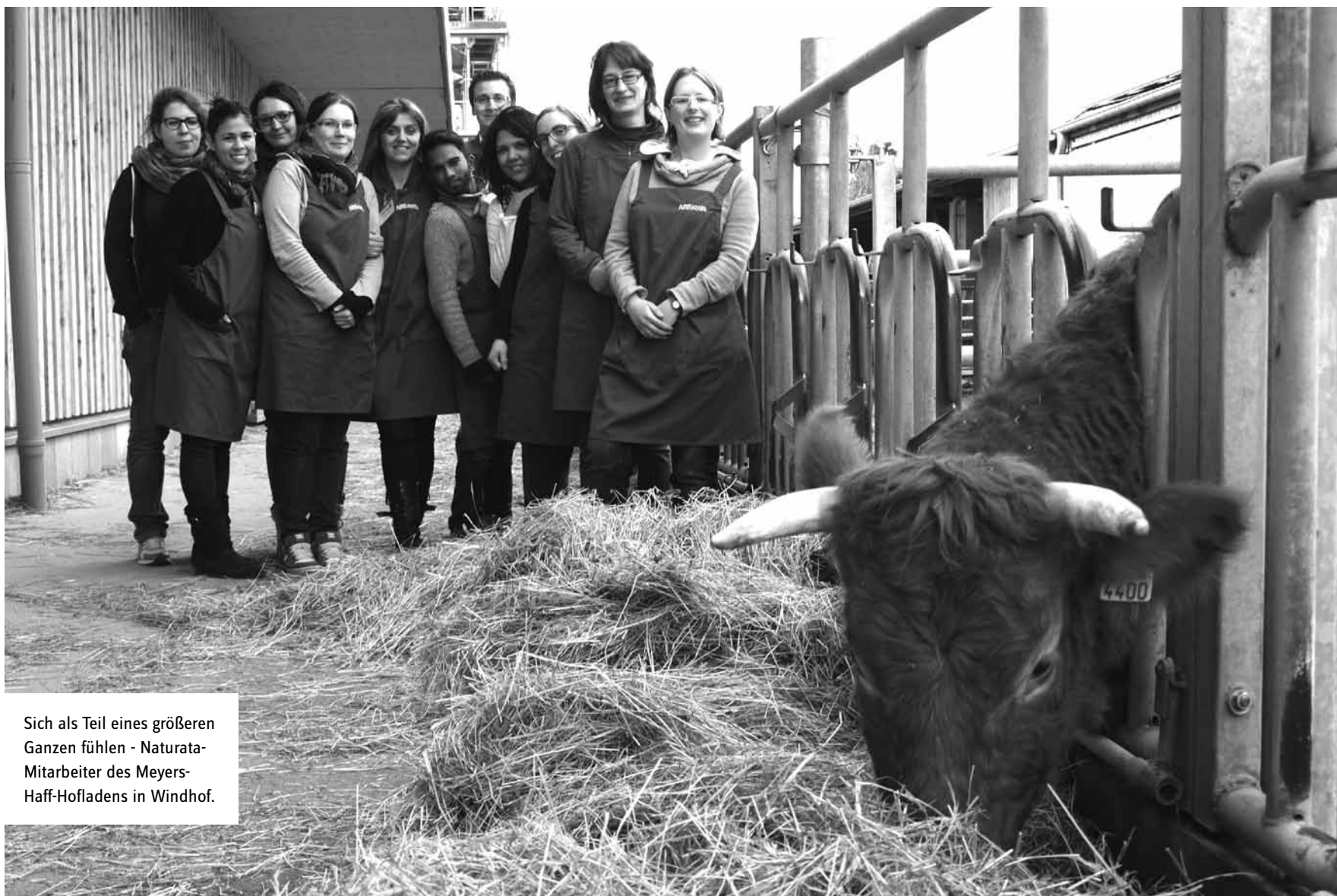
Sich als Teil eines größeren Ganzen fühlen - Naturata-Mitarbeiter des Meyers-Haff-Hofladens in Windhof.

lassen und erhielt 633 Punkte von 1000 möglichen.