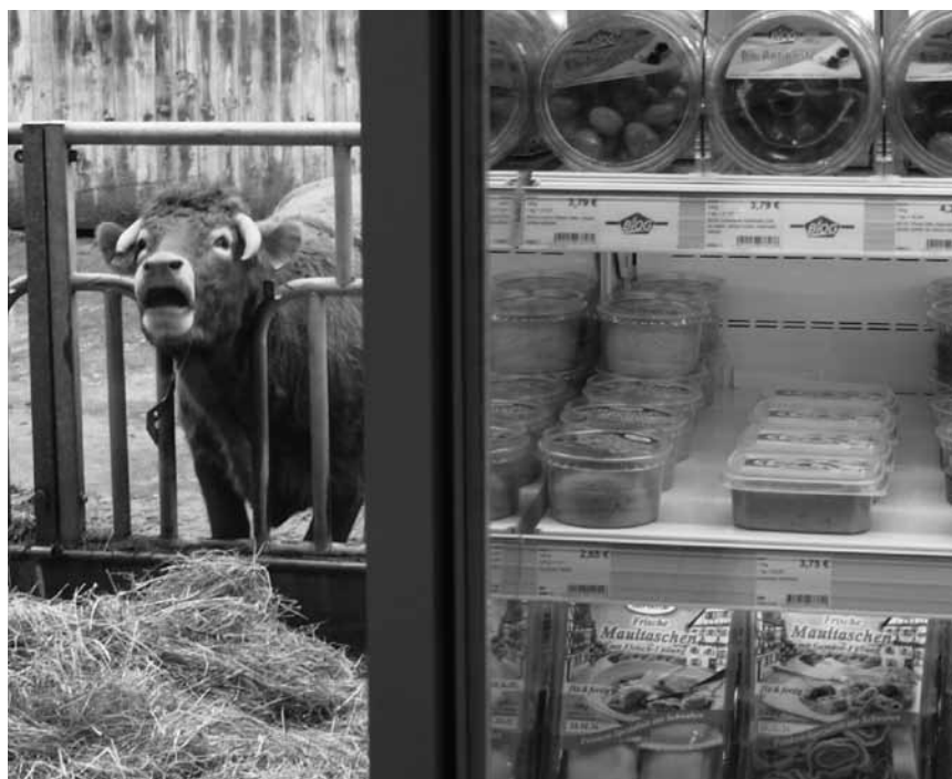
Wo kommt mein Fleisch her? Blick hinter die Hofladentheke.

reich 2010 die Schaffung der „Bank für Gemeinwohl“ in die Wege geleitet. Sie wird - ganz wie die in Belgien im Entstehen begriffene Bank NewB - eine Genossenschaftsbank für Privatpersonen sein, die Girokonten verwaltet und Kredite vergibt, die nicht zwingend an kommerzielle Tätigkeiten gebunden sind. Das unterscheidet beide Banken von der Triodos- und GLS-Bank sowie auch von dem etika-Mechanismus. Bedingt durch unterschiedliche administrative und juristische Beschränkungen konnten erst ab 2015 Personen zum Zeichnen geladen werden.