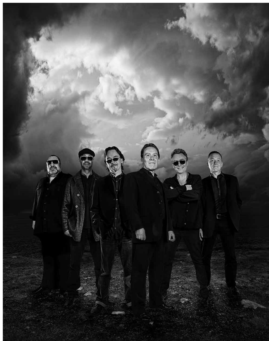
Seit 1978 erfolgreich mit Cover-Songs unterwegs: Die britische Reggae-Band UB40 ist am 26. Oktober im hauptstädtischen Atelier zu Gast.