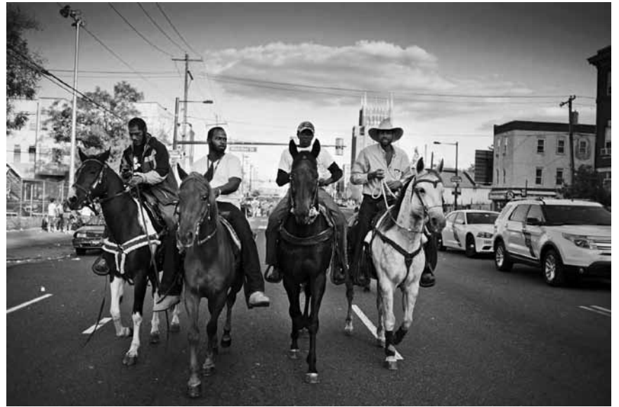
Au-delà de la photographie : l'exposition « Something Real » au Pomhouse du CNA de Dudelange explore les nouvelles écritures photographiques - jusqu'au 3 décembre.