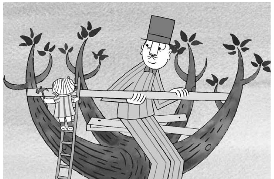
Der große Uncle und „Lilla Anna“ verbindet eine ungewöhnliche Freundschaft: Rechtzeitig zu den Herbstferien schafft es der schwedische Kinderfilm in französischer Fassung in die Säle von Utopolis Belval und Kirchberg.