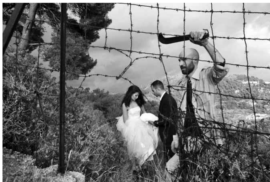
Défier la forteresse Europe en feignant un mariage : c'est l'histoire vraie à l'origine de « Io sto con la sposa », au Starlight dans le cadre du Festival du film italien de Villerupt.

Peppino vit dans un village de montagne. À Rome, les responsables politiques ne trouvent pas d'accord pour élire un nouveau président de la République. Pour temporiser, les parlementaires glissent dans l'urne des noms farfelus, jusqu'au moment où Giuseppe Garibaldi obtient la majorité. Or il y a bien un Giuseppe Garibaldi vivant, qui est donc élu, et ce n'est autre que... Peppino.