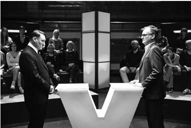
Selbst Frank Plasberg findet Hitler nur mäßig komisch.