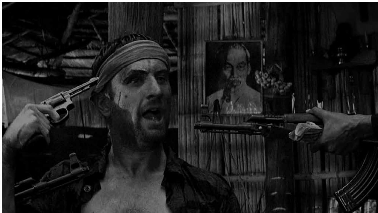
La guerre du Vietnam vue par Michael Cimino : « Deer Hunter », le 20 novembre à la Cinémathèque.

Alors que la maladie d'Alzheimer continue d'affecter des millions de personnes, ce documentaire révèle une percée dans le domaine, basée sur l'utilisation de la musique. Filmés