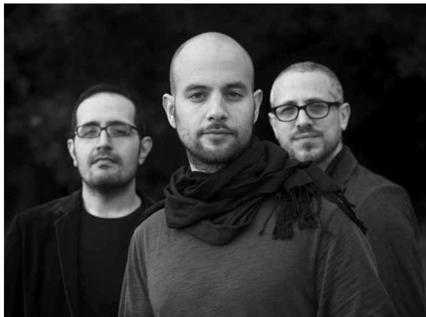
Wenn man schon so heiß... der israelische Jazz-Pianist Shai Maestro gastiert am 19. November mit seinem Trio im Cube 521 in Marnach.

Immagine e parola me ne fregol - il fascismo e la lingua italiana , projection du documentaire de Vanni