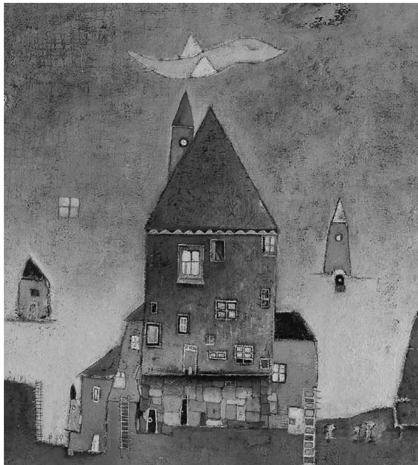
Un peu de douceur en ces temps barbares : les dessins sensibles et ludiques de Jérôme Cames sont à la galerie Schortgen à Luxembourg jusqu'au 5 décembre.

Krome Gallery (21a, av. Gaston Diderich, tél. 46 23 43), jusqu'au 23.12, je. - sa. 12h - 18h.