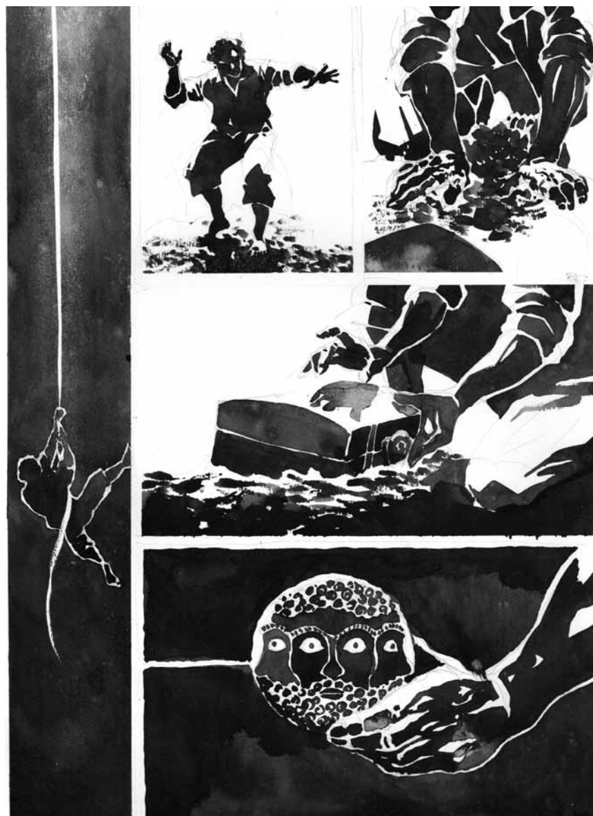
Derniers jours : les illustrations de Marc Angel et les photographies de Christophe Olinger sont encore à voir jusqu'à ce dimanche à la galerie « Op der Kap » à Capellen.