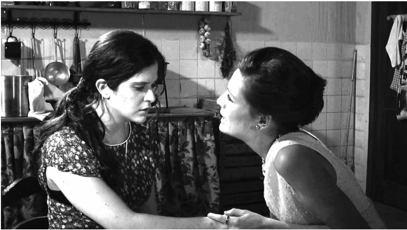
Portrait d'une famille madrilène des années 1960 : « El Mundo sigue », de Fernando Fernán Gómez, vendredi à la Cinémathèque.

Même si la celle-ci est absente du film, il en reste un parfum de l'Orient brûlant et fascinant. Pasolini est allé à travers l'Asie et l'Afrique, en Érythrée, au Népal, au Yémen, en Iran, à la recherche de ses décors et de ses personnages. Il les voulait à l'écart des circuits touristiques, comme préservés de l'histoire, surprenants et vrais.