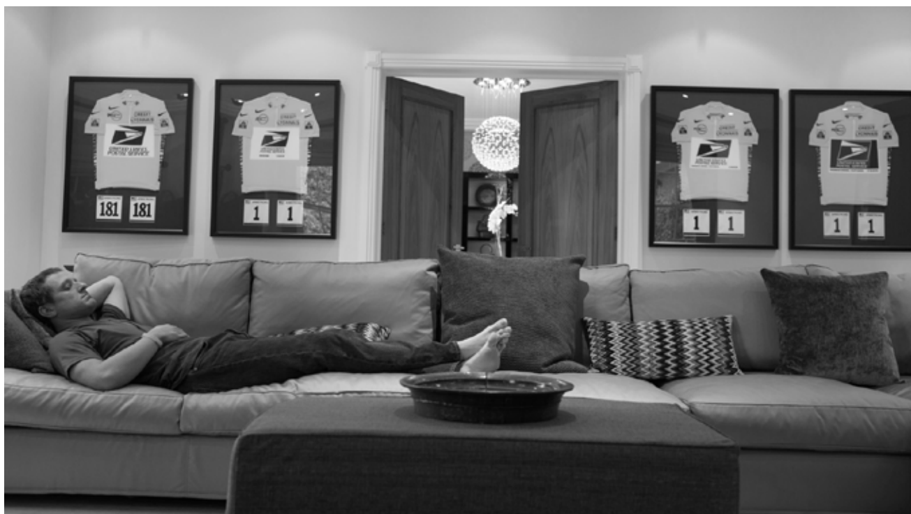
Maillots jaunes exposés dans une somptueuse demeure, canapé aux dimensions généreuses : la gloire reste cependant toujours éphémère...