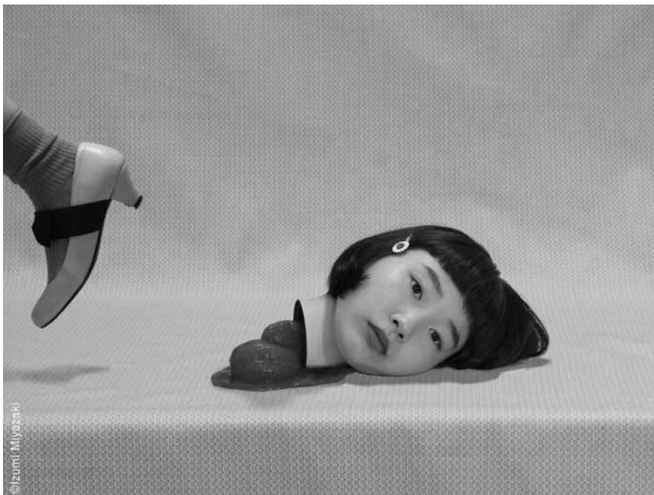
À en perdre la tête : « Curated by ... Off Shot Japan », à la Wild Project Gallery à Luxembourg, du 5 décembre au 16 janvier 2016.