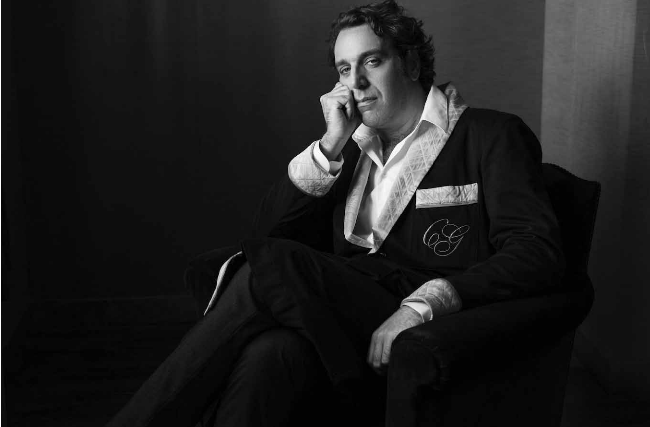
Chilly Gonzales : un look cosy pour une musique qui bouge.