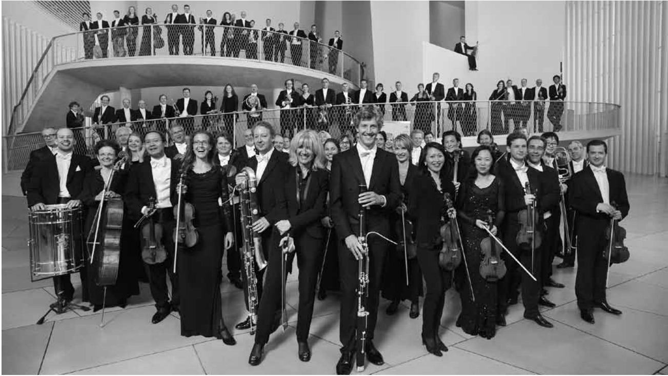
Mieux que celle des députés, ou du moins moins cacophonique : « La chambre philharmonique », sous la direction d'Emmanuel Krivine, jouera des œuvres de Brahms et de Woll le 12 décembre à la Philharmonie.

The Aristocrats , Spirit of 66, Verviers (B), 20h. www.spiritof66.be