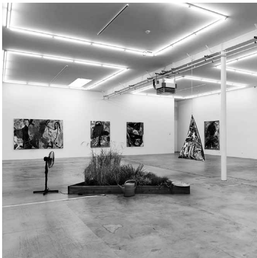
Des artistes en masse : « Feed the Meter » à Koerich réunit des jeunes pousses new-yorkaises à l'espace d'exposition Bernard Ceysson - jusqu'au 9 janvier 2016.