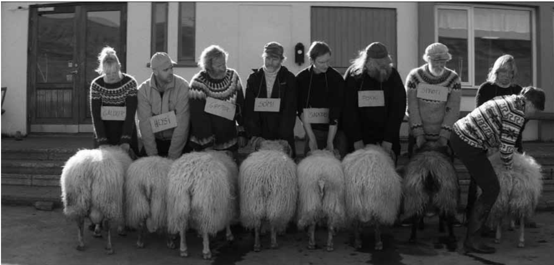
Le moment fort de la saison estivale en ce coin perdu d'Islande : le concours du meilleur bélier.