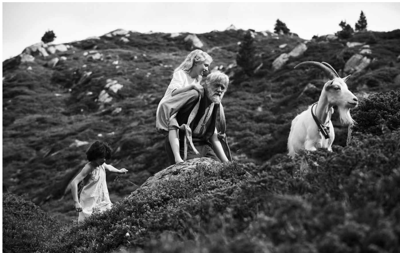
Auf der Alm, da gibt's ka Sünd... dafür aber „Heidi“ - in der 2015er Version. Neu im Cinémaacher, Orion, Starlight, Sura, Utopolis Belval und Kirchberg.

Waisenmädchen Heidi lebt mit seinem Großvater, dem Almöhi, abgeschieden in einer kleinen Holzhütte in den Schweizer Bergen. Sie und ihr Freund, der Geißenpeter, hüten die Ziegen und führen ein unbeschwertes Leben. Doch eines Tages wird Heidi von ihrer Tante Dete aus der Almidylle herausgerissen und nach Frankfurt gebracht, wo sie in der Familie des wohlhabenden Herrn Sesemann untergebracht wird. Heidi soll die Spielgefährtin für die im Rollstuhl sitzende Tochter Klara geben und unter der Aufsicht des strengen Kindermädchens Fräulein Rottenmeier esen und schreiben lernen.