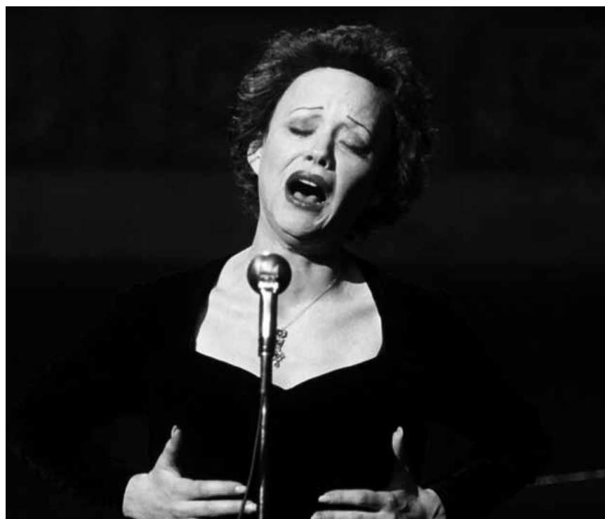
L'interprétation d'Édith Piaf dans « La Môme » valut un Oscar à Marion Cotillard - à revoir ce samedi 19 décembre à la Cinémathèque.

Auf einer griechischen Insel betreibt die alleinerziehende Donna ein kleines Hotel. Ihre nunmehr 20-jährige Tochter