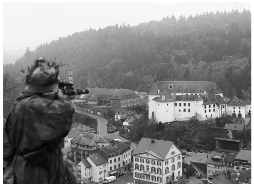
De Lëtzebuurger hire Lieblingsthema alt nees op Zelluloïd gebrannt: „D'Preise së rëm zeréck - Alamo zu Cliärref“ vum Michel Tereba - am Ariston, Ciné Waasserhaus a Sura.