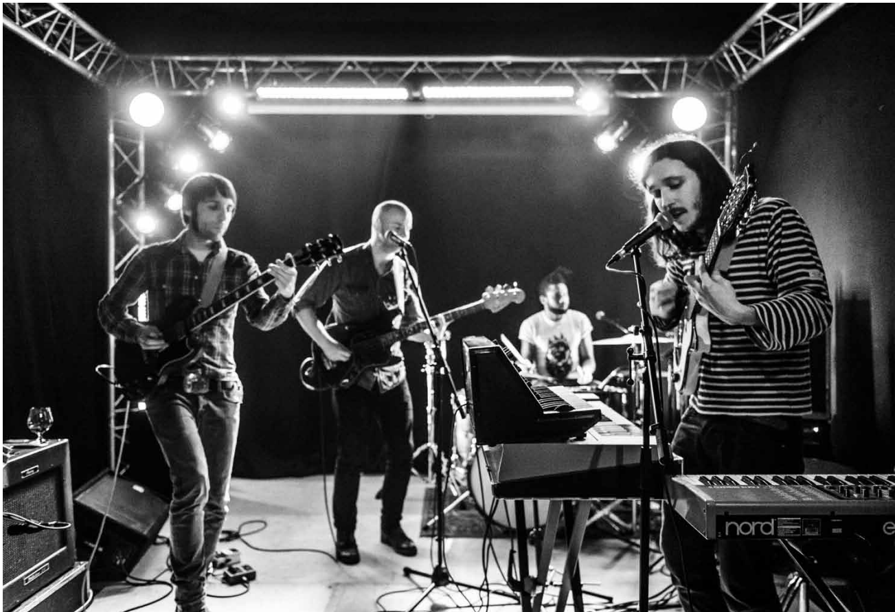
Musik wie ein Film: Forever Pavot.