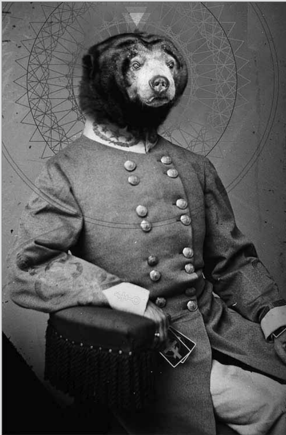
MIK MUHLEN LORD MARCUS SOL, 2010. COLLAGE NUMÉRIQUE, 42 X 32 CM.