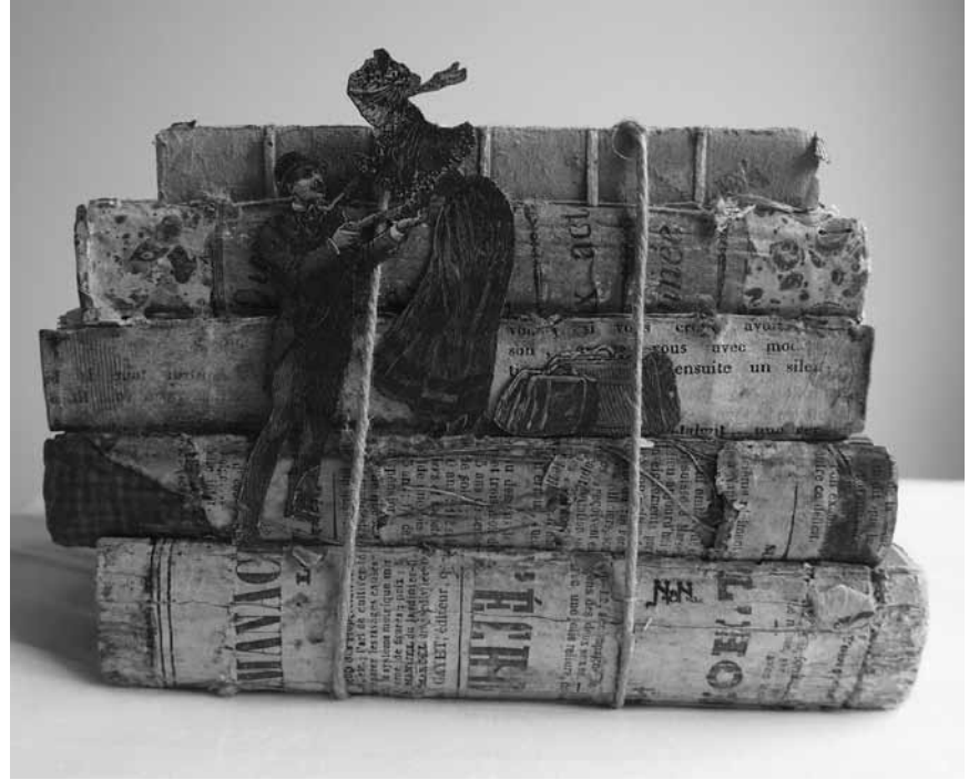
Que du beau à voir à Arlon ! Jusqu'au 6 février, l'espace Beau Site y présente des « Univers singuliers ».